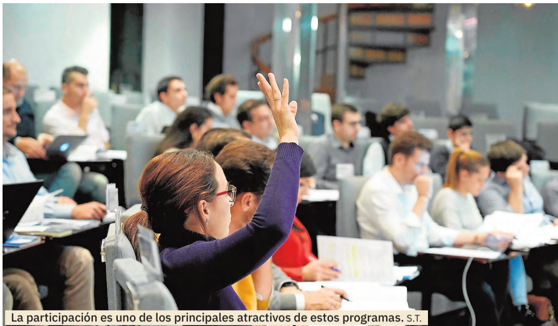
La participación es uno de los principales atractivos de estos programas. S.T.

El grado de satisfacción de los más de 11.500 antiguos alumnos ha hecho posible que esta escuela de negocios se haya posicionado entre las mejores del territorio nacional.