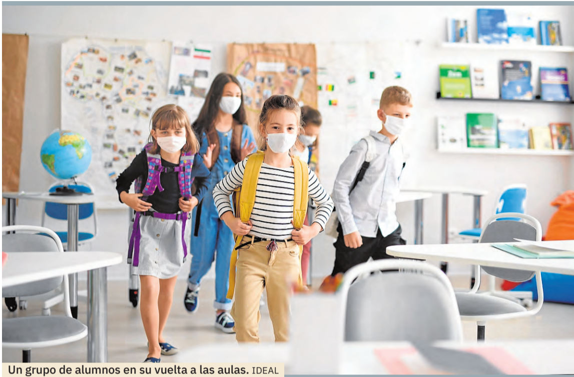
Un grupo de alumnos en su vuelta a las aulas.

Tras más de medio año con las aulas cerradas, España se ha adentrado en el curso más raro que se recuerda. Septiembre ha hecho que la mayoría de centros educativos y universidades del país hayan abierto sus puertas con dudas, certezas y novedades. Una tríada de cuestiones que están marcadas por las circunstancias actuales y que también se basan en lo que sucede fuera de nuestras fronteras para tomar nota.