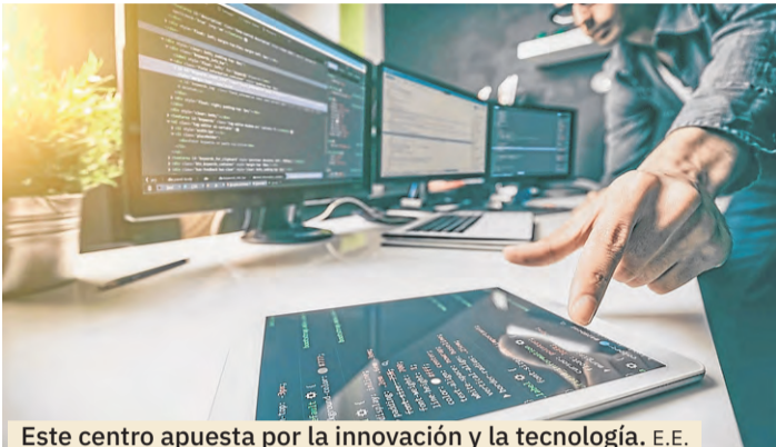
Este centro apuesta por la innovación y la tecnología. E.E.

es[tech] está especializada en tecnologías aplicadas a la animación 3D y el desarrollo de soluciones digitales.