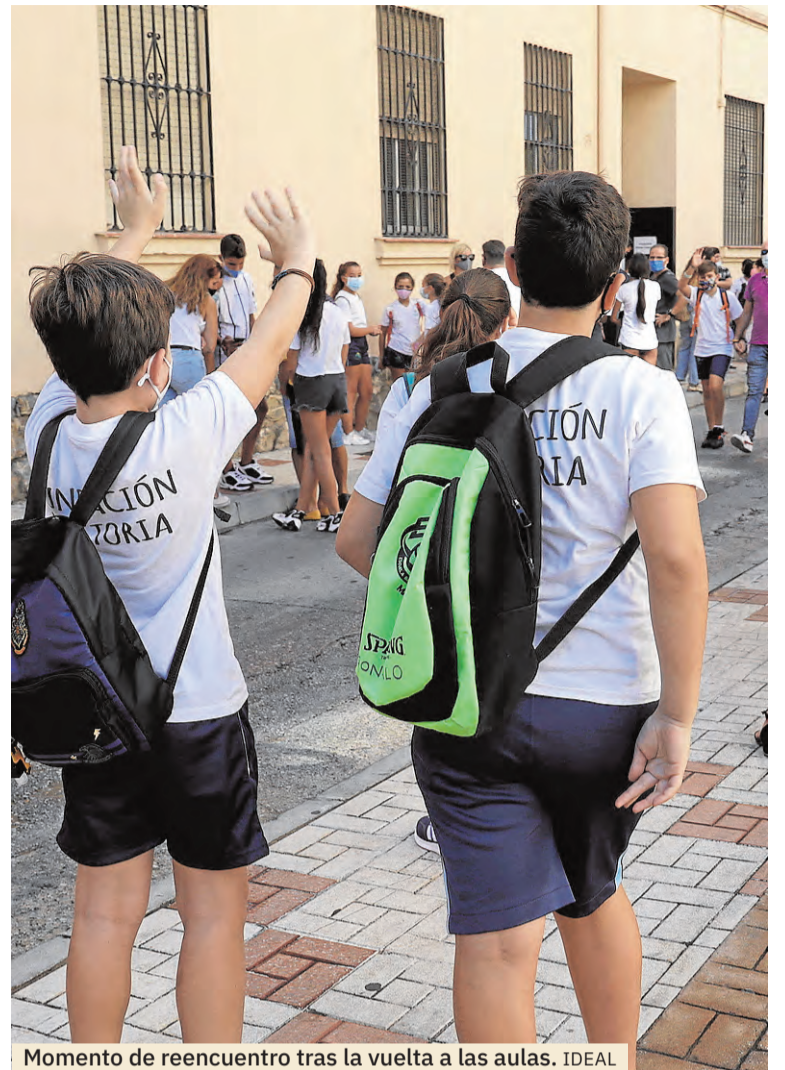
Momento de reencuentro tras la vuelta a las aulas.

«Entiendo que haya una situación de alarma con la 'vuelta al cole', pero los pediatras tenemos el deber de no alarmar más y en-