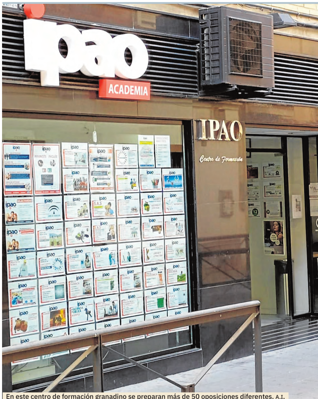
En este centro de formación granadino se preparan más de 50 oposiciones diferentes. A.I.