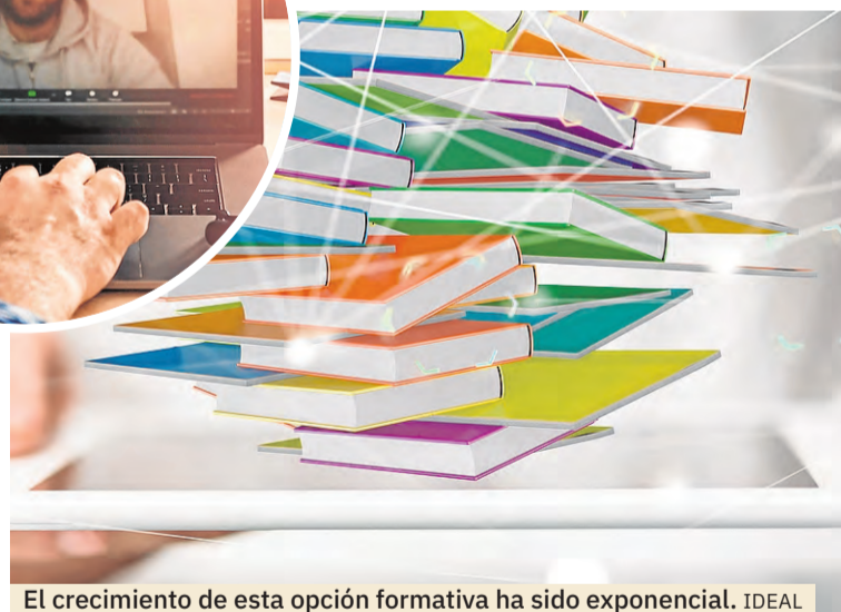
El crecimiento de esta opción formativa ha sido exponencial. IDEAL

peciales. Las materias y los objetos de estudio se pueden adaptar para las personas que requieran de otros niveles de accesibilidad. Las personas sordas pueden contar con elementos didácticos concretos y las que padecen ceguera pueden contar con los suyos propios.