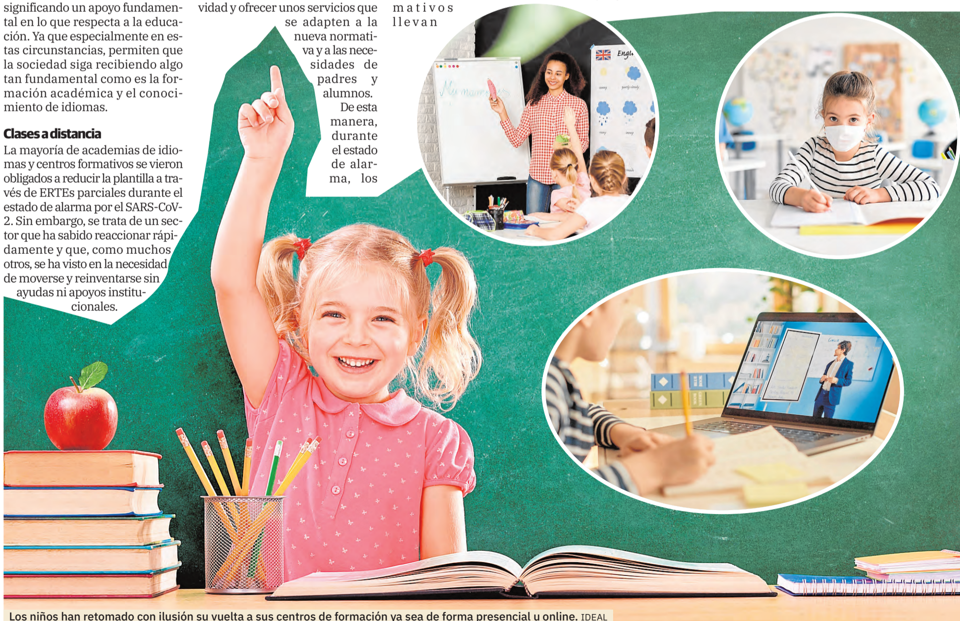
Los niños han retomado con ilusión su vuelta a sus centros de formación ya sea de forma presencial u online.

Otra de las ventajas que ofrecen estos centros de formación es que están especializadas en desarrollar métodos de enseñanza que optimicen el progreso de sus alumnos y la consecución de los objetivos de cada estudiante. Algo que consiguen a través de diferentes técnicas de aprendizaje y dinámicas. En este sentido, durante la pandemia de coronavirus, las academias también suponen un apoyo más cercano para familiarizarse con las nuevas tecnologías y las clases online. Ya que sus profesionales tienen la oportunidad de dedicar una atención más personalizada al alumnado.