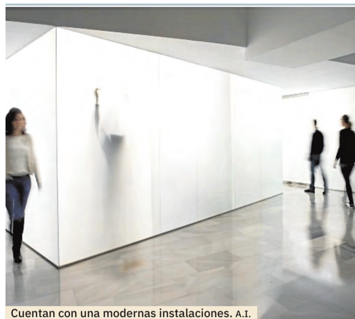
Cuentan con una modernas instalaciones. A.I.

Otra de las áreas formativas en las que se ha consolidado IPAO es la de Escolar y Universidad. Para sus estudiantes, IPAO cuenta con clases de preparación, apoyo o recuperación de asignaturas de Universidad, Selectividad, Bachillerato, E.S.O. y pruebas de acceso.