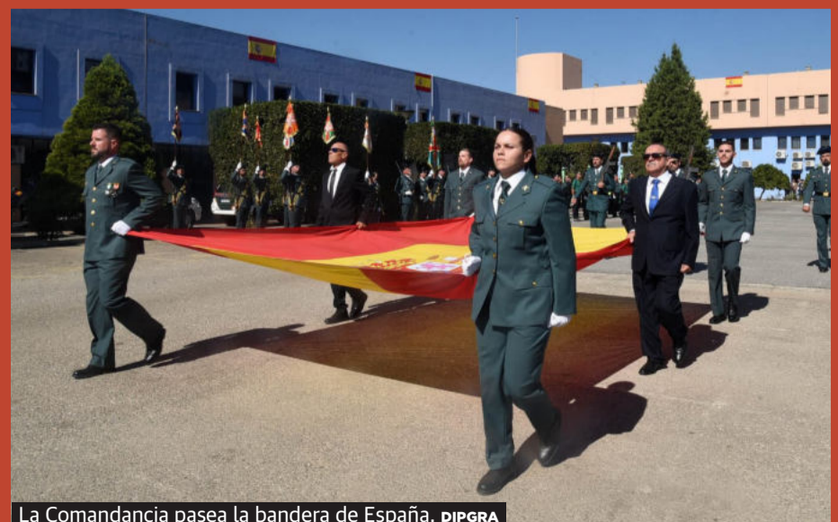
La Comandancia pasea la bandera de España.