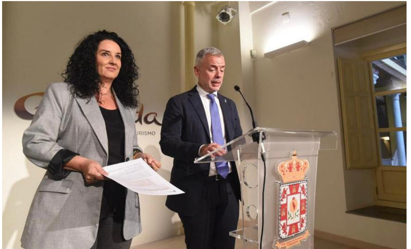
La Diputación de Granada celebra la Junta de Gobierno Provincial.

Las localidades beneficiadas obtendrán asesoramiento económico y técnico, si bien se desarrollarán planes de formación en corresponsabilidad y cuidados dirigidos a hombres, se crearán bolsas de cuidado profesional para familias con hijos de hasta