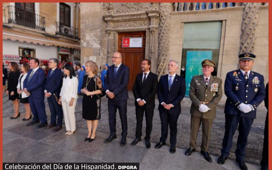
Celebración del Día de la Hispanidad.