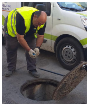
Control de plagas. DIPGRA

Durante el último mes, la Diputación de Granada junto con Biblion Ibérica ha implementado un plan integral de control de plagas, con el objetivo de preve-