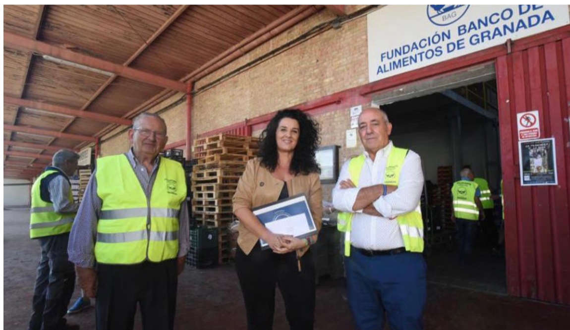
Visita al Banco de Alimentos de Granada. DIPGRA

El área de Bienestar Social incrementará la ayuda económica para cubrir la provincia»