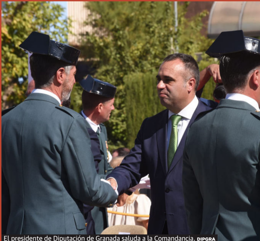
El presidente de Diputación de Granada saluda a la Comandancia.