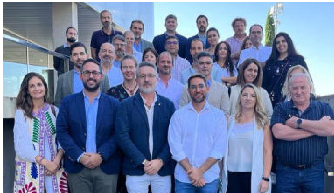
Representantes de la Diputación de Granada en la presentación del Proyecto Europeo Solar.

Este proyecto busca promover las mejores prácticas y capacitar al sector de PYMES