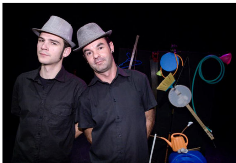
Vuelve 'Zona de Jazz'. DIPGRA

El propósito del programa «Zona de Jazz» es ofrecer a los niños y niñas la oportunidad de experimentar la música en vivo, fomentando la asistencia regular a conciertos, acercándolos a