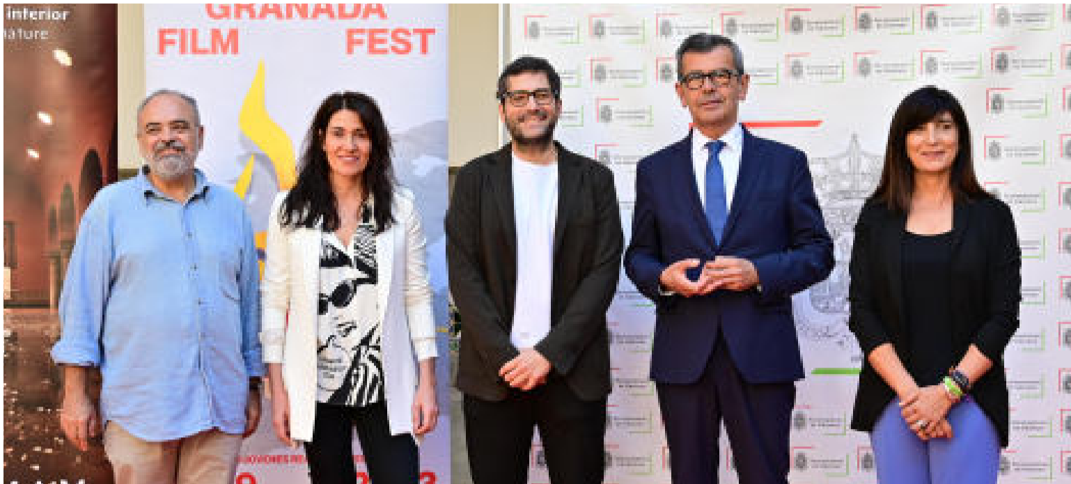
La diputada de Cultura asistió a la presentación del 29º Festival de Jóvenes Realizadores.

Diputación aumenta este año su aportación económica al evento, al que ha apoyado desde la 1ª edición