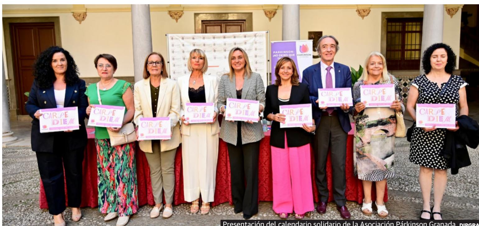
Presentación del calendario solidario de la Asociación Párkinson Granada.