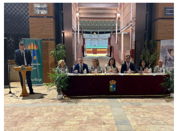
Atarfe acogerá la II Exhibición de Enganches. DIPGRA