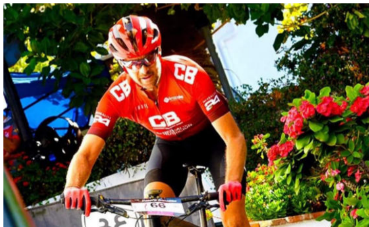
En su tiempo libre, practica escalada, senderismo y pádel. DIPGRA

nuevos. Nunca nos habían dado la oportunidad de demostrar de lo que somos capaces, y ahora vamos a poder hacerlo», ha celebrado.