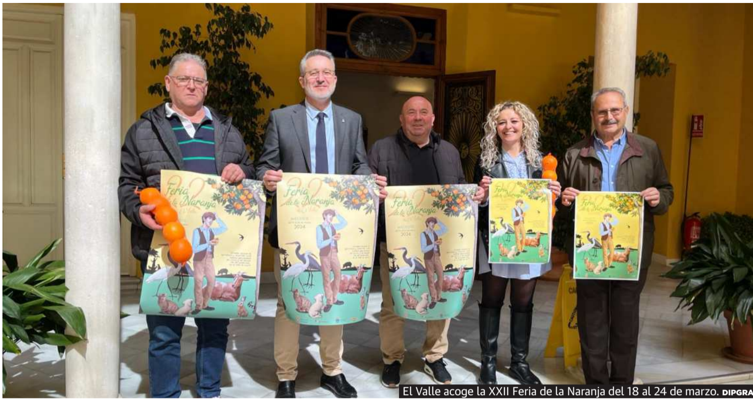
El Valle acoge la XXII Feria de la Naranja del 18 al 24 de marzo. DIPGRA