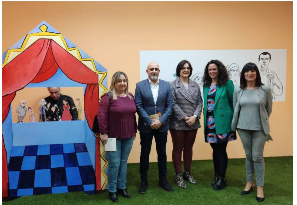
El Museo Casa Natal de Lorca lanza su IX Programa Didáctico. DIPGRA

Martín ha considerado que «esta propuesta, más allá de ser una mirada nostálgica al pasado, también sirve como un recordatorio de la vigencia del 'teatro de