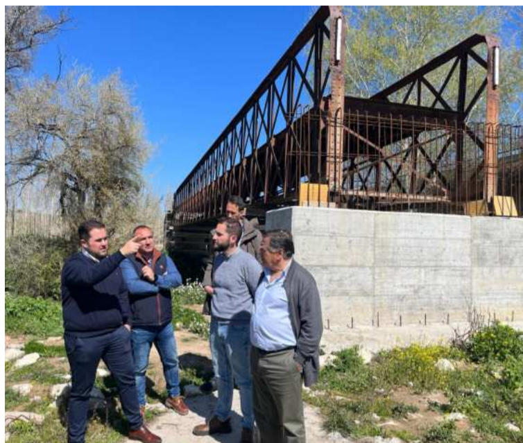
Visita institucional a Láchar. DIPGRA

La obra realizada con anterioridad ha constado de tres operaciones diferenciadas, incluyendo la ejecución de la cimentación en el nuevo emplazamiento, el arreglo estructural y el traslado del puente mejorado al lugar en cuestión. Sin embargo, aunque la reparación estructural se ha completado, aún quedan algunas obras pendientes de «gran relevancia», según la Diputación, que permitan a los visitantes un acceso cómodo para disfrutar de uno de los puntos de mayor inte-