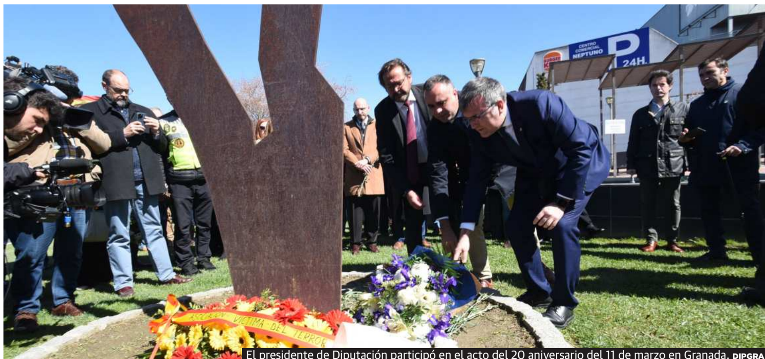
El presidente de Diputación participó en el acto del 20 aniversario del 11 de marzo en Granada.