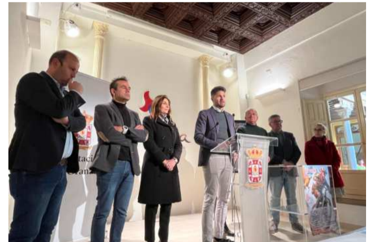
Presentación del I Tour Pirata MTB. DIPGRA

Así, este sábado 16 de marzo, se disputarán las categorías escuelas y máster (masculinas y femeninas) y el domingo 17, élite, sub23, júnior y cadete (masculinas y femeninas). Este evento UCI C2 otorgará puntos y premios económicos comprendidos entre los 25 y 250 euros a los ganadores en cada categoría de la cita, que remarca el compromiso de la Diputación de Granada con impulsar el deporte en la provincia.