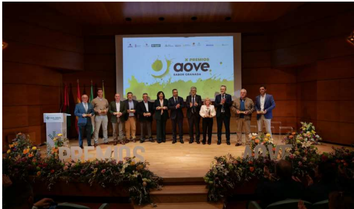
Diputación entrega los Premios AOVE 2024.

Se han registrado más de 700 peticiones del Ciclo Integral del Agua, más de cuatro millones de euros para asistencias técnicas, implantación de telegestión y mantenimientos para mejorar la red de abastecimiento y hacer más eficiente la gestión del agua. Y se contratará a más de 70 agentes medioambientales con 1,1 millones para impulsar la gestión de Emergencias y reforzar la capacidad de respuesta de Protección Civil, entre otros.