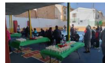
Jornada en Fornes. DIPGRA

La Diputación de Granada reafirma su compromiso con el desarrollo integral de todos los municipios de la provincia, impulsando iniciativas que promuevan la mejora de las infraestructuras y contribuyan al crecimiento económico y turístico. A través de programas como el Plan de Carreteras, se garantiza la ejecución de proyectos que respondan a las necesidades de los municipios, promoviendo así el bienestar y el progreso.