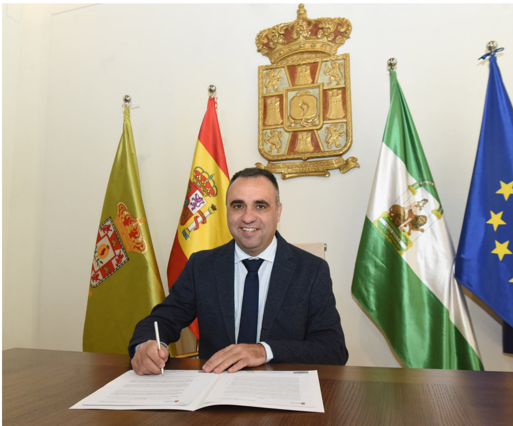
El presidente de la Diputación de Granada, Francis Rodríguez.

[02] El presidente de la Diputación de Granada, Francis Rodríguez, ha anunciado que a través de la Concertación Local 2024-2025 se impulsarán las políticas sociales, hídricas y culturales y se favorecerá la colaboración con las entidades locales