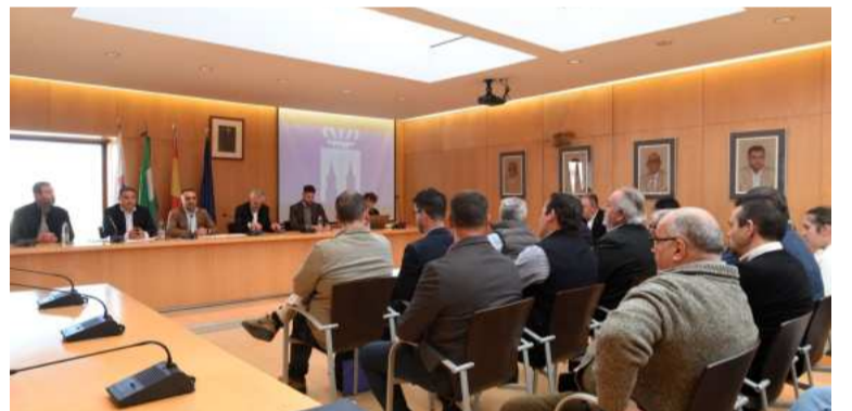
Reunión sobre la concertación en Alpujarra. DIPGRA