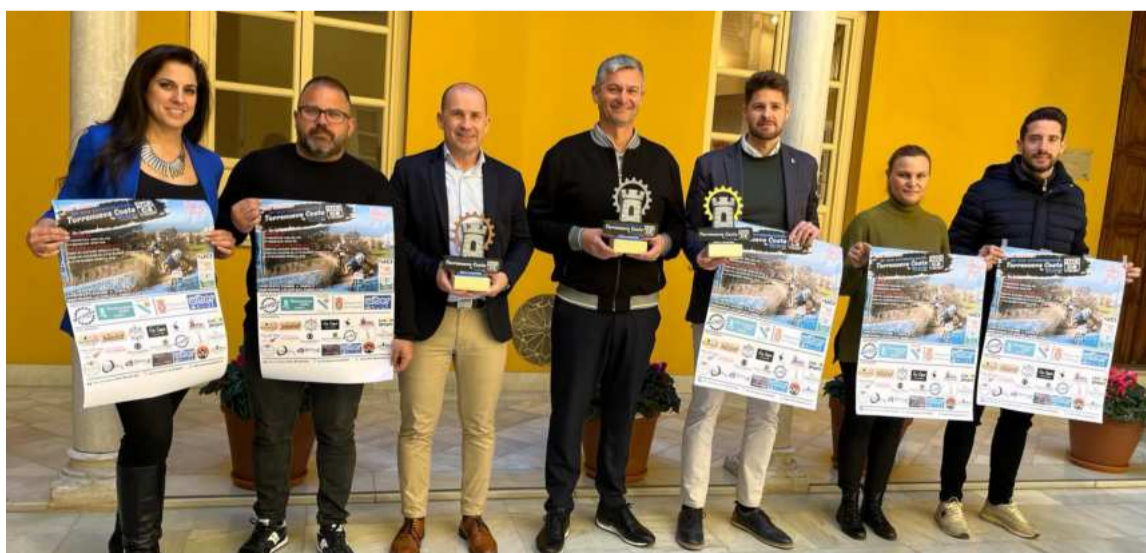
Presentación de la VII GP XCO Internacional Torrenueva Costa. DIPGRA

Para participar es necesario disponer de una bicicleta y un casco protector y que los menores de edad vayan acompañados por un adulto y cuenten con la autorización de su tutor. Se podrán formalizar inscripciones para todo el tour o para una sola prueba.