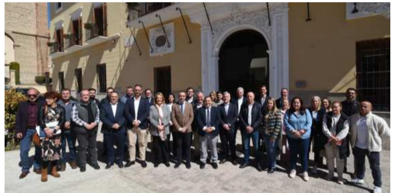
Reunión sobre la concertación en Costa Tropical. DIPGRA