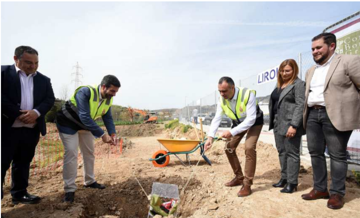
El presidente de Diptuación coloca la primera piedra del centro formativo de Bomberos en Loja.

Se invertirá más de un millón y medio de euros en este centro pionero en Andalucía