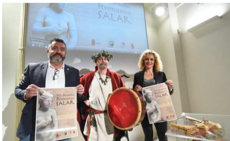
Salar acoge las VII Jornadas Romanas.