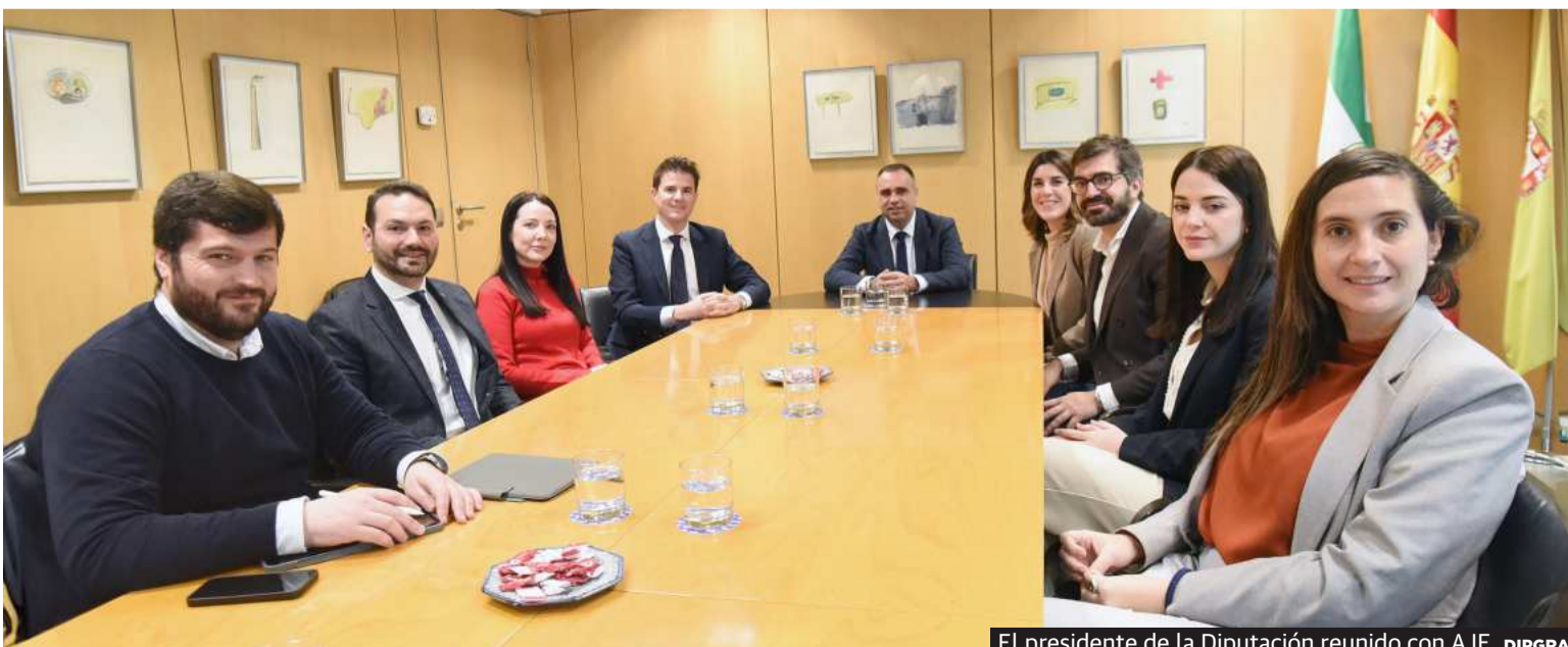
El presidente de la Diputación reunido con AJE. DIPGRA

A lo largo de este año, la Diputación de Granada y el Ayuntamiento de Almuñécar darán los pasos oportunos para la tramitación del personal y los bienes municipales dirigidos al Servicio de Bomberos de la Diputación de Granada.