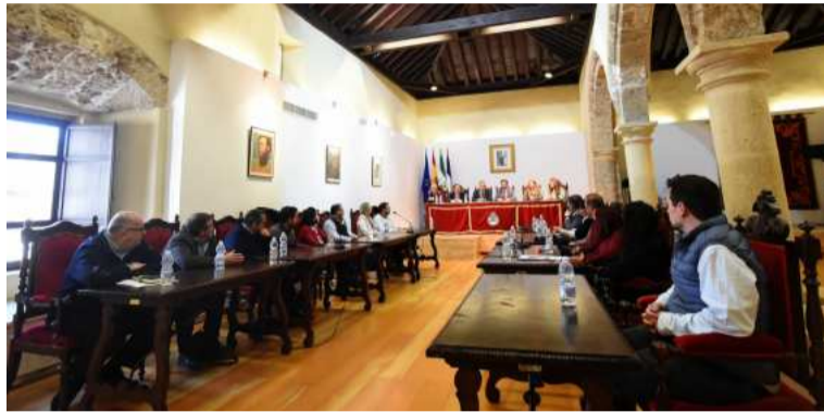
Reunión sobre la concertación en Loja. DIPGRA

Con estos acuerdos se garantiza que todos los municipios puedan prestar mejores servicios públicos en materia cultural, de agua, deportiva o de políticas sociales. «El reto que ha asumido el nuevo equipo de Gobierno ha sido primar la voluntad de mejorar el bienestar de los vecinos volviendo a llenar de vida nuestros pueblos, eso sí, haciendo frente a una gestión eficaz y eficiente de los recursos naturales, sobre todo del agua, tan escasa en estos momentos de acuciante sequía», ha subrayado.