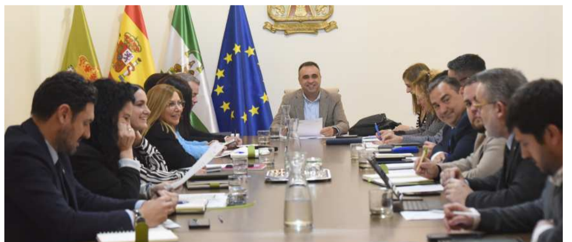
Presentación del Plan Anual de Contratación. DIPGRA

En esta línea, la diputada ha remarcado que «el documento viene a facilitar la concurrencia de las pymes, apoyando al tejido empresarial, al tiempo que supone un mecanismo para reforzar las transparencias, al fomentar la competencia mediante esa información anticipada», si bien ha detallado que en el plan se inte-