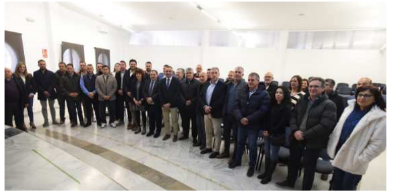
Reunión sobre la concertación en Guadix.