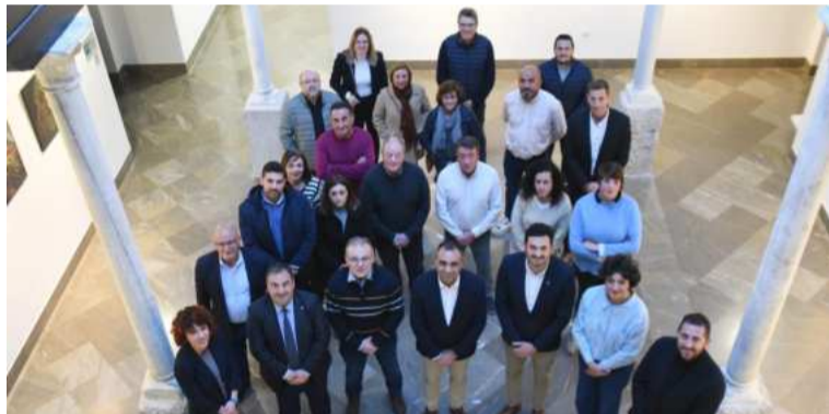
Reunión sobre la concertación en Baza y Huéscar. DIPGRA