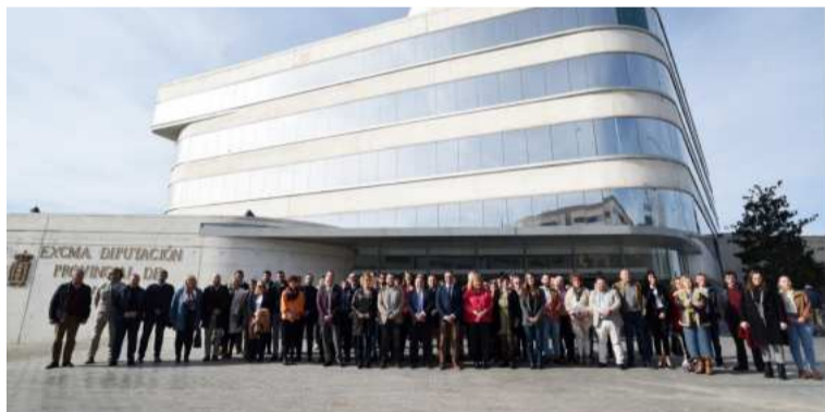
Reunión sobre la concertación en Área Metropolitana. DIPGRA