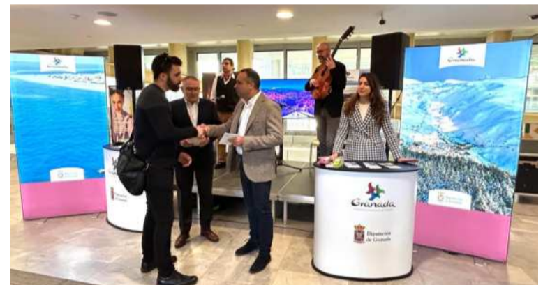
Exhibición de los atractivos de Granada en la capital francesa.

La conexión aérea entre Granada y París es operada por la compañía Vueling con el aeropuerto de Orly y tiene dos frecuencias semanales. Esta ruta es de gran importancia para el sector turístico de Granada, ya que abre la puerta aérea al principal mercado emisor de turismo internacional hacia nuestra provincia. En la actualidad, Francia es el primer cliente de Granada, con 122.000 turistas alojados en hoteles cada año.