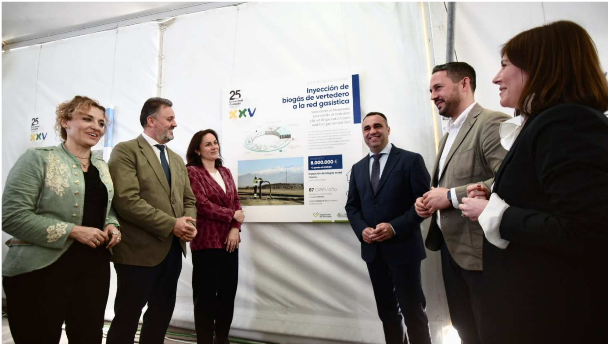
Acto de clausura del 25 aniversario de la Ecocentral de Diputación en Alhendín.