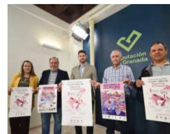
Presentación del premio. DIPGRA

Entre las novedades de esta prueba destaca que la señalización de un 80% de las carreras de esta competición la llevarán a cabo miembros de la Asociación Vale de Dúrcal. Además, será 100% reciclada y reciclable. Por otro lado, las banderolas, las cintas y las flechas se harán con materiales reciclados con el objetivo de contribuir a preservar los espacios por los que transcurre la prueba, muestra inequívoca del compromiso común de salvaguardar el planeta.