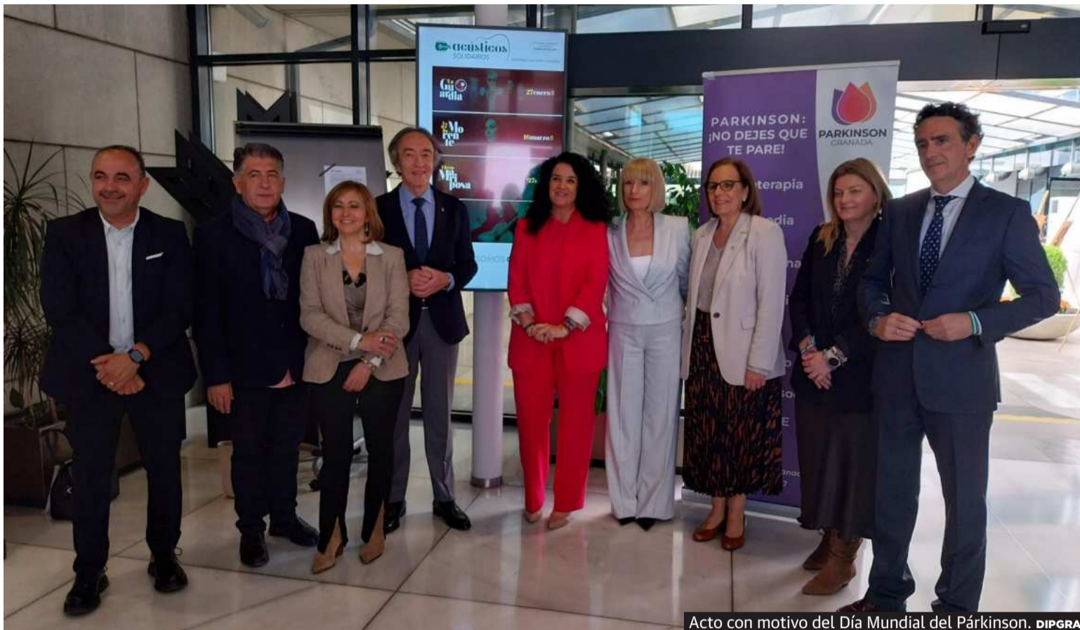
Acto con motivo del Día Mundial del Párkinson. DIPGRA