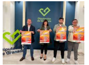
Presentación del festival. DIPGRA

La VII Semana de la Vega de Granada se presenta como una oportunidad para que residentes y visitantes se sumerjan en la riqueza de la cultura agrícola de esta zona, al tiempo que reflexionan sobre la importancia de proteger y promover un modelo de agricultura sostenible para las generaciones futuras.