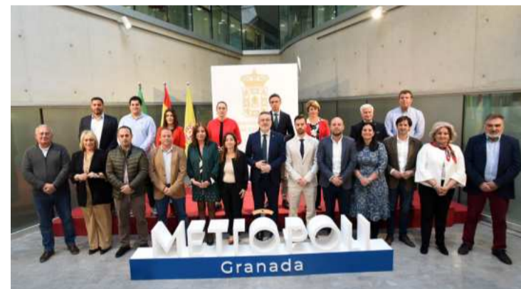
La sede de Diputación acoge las jornadas 'Granada Metrópoli'.