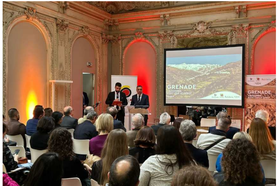
El presidente de la Diputación promociona la provincia en París.

La acción promocional ha tenido lugar en la sede del Instituto Cervantes de París, que junto a la Oficina Española de Turismo en la capital francesa también ha colaborado en la organización del encuentro, al que han acudido más de 75 agentes y turoperadores. Durante el evento, además, se han realizado varias presentaciones de Granada como destino turístico respaldadas por videos promocionales. El acto ha tenido como colofón una actuación musical de la agrupación GRX Ensemble, con obras clásicas y tradicionales de Lorca, Falla y Agustín Lara.