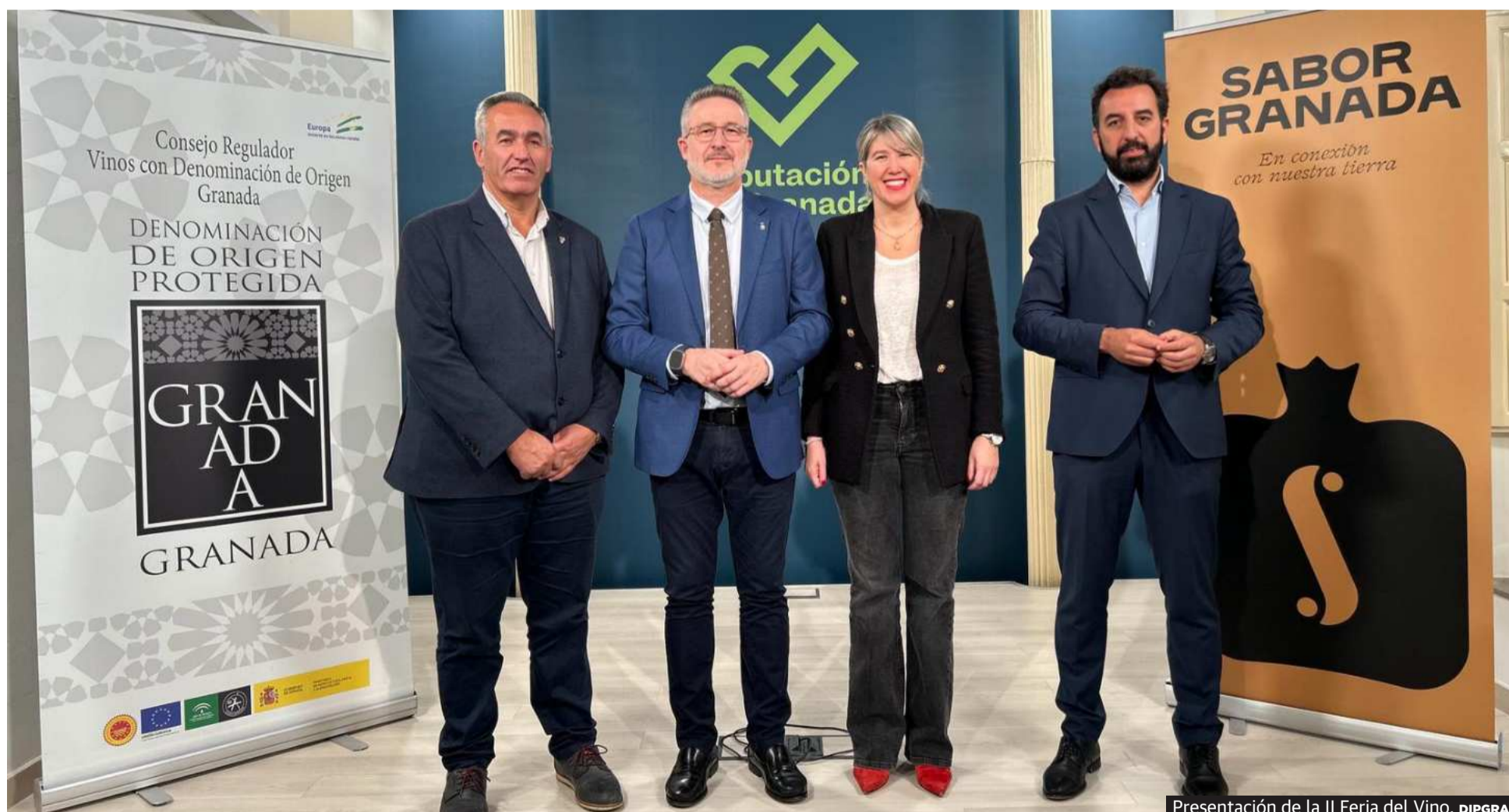
Presentación de la II Feria del Vino.

El objetivo es «fomentar el ciclismo y todas las disciplinas deportivas, que cada rincón de Granada se convierta en un espacio donde se respire el espíritu deportivo, se impulse el talento y se brinden oportunidades para que cualquier persona se pueda desarrollar como deportista», ha afirmado el diputado.