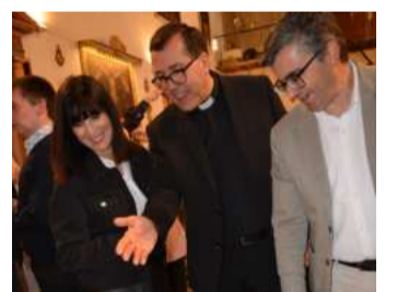
Visita a Víznar. DIPGRA