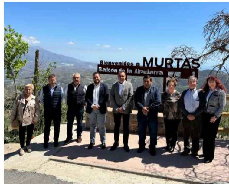
Visita institucional a Murtas.

Asimismo, Murtas se beneficiará de un aumento del Plan de Obras y Servicios de la Diputación por el que recibirá 271.000 euros para acometer proyectos que mejorarán el día a día de sus vecinos durante el mandato.