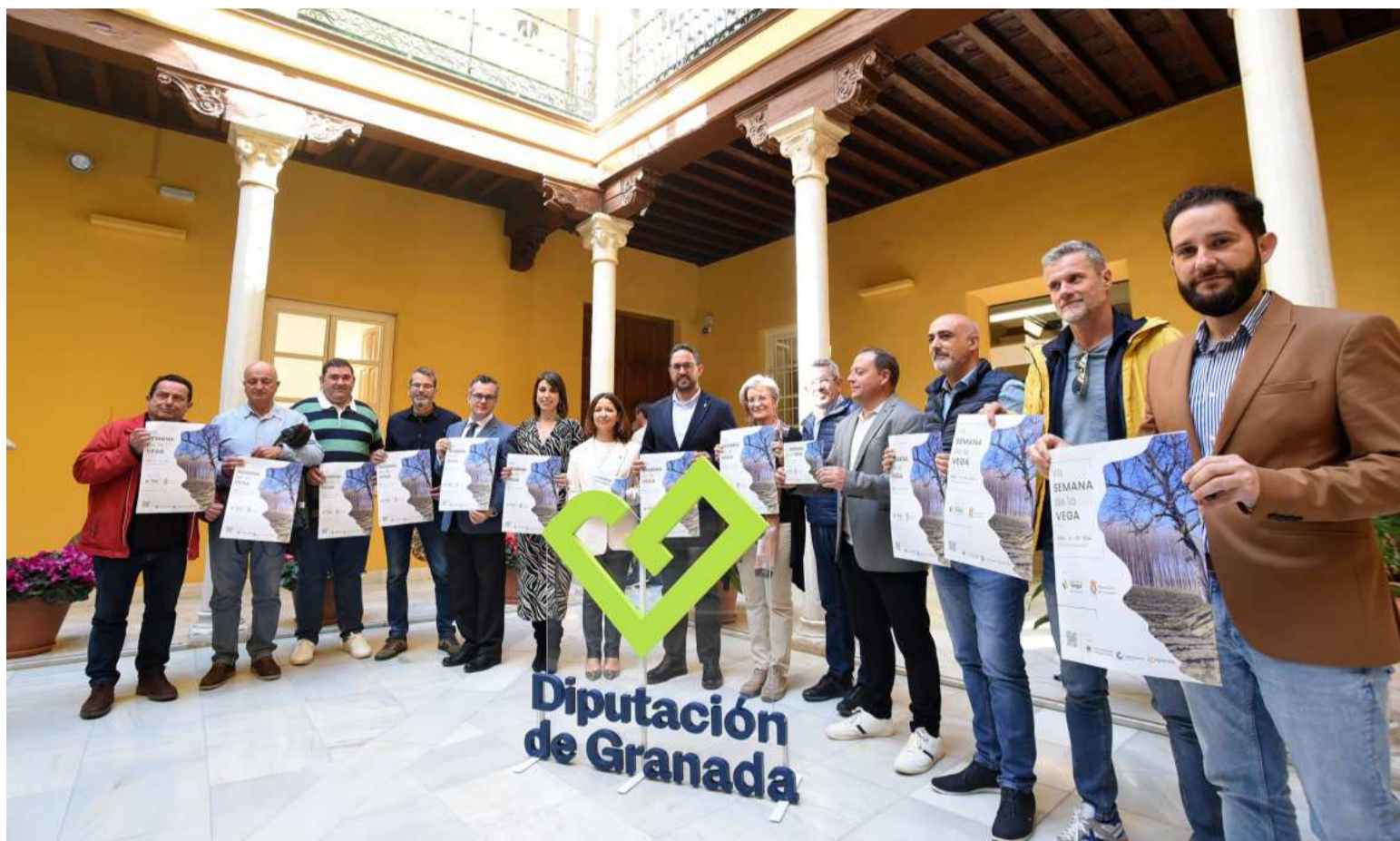
Presentación de la II Semana de la Vega de Granada. DIPGRA

«Seguimos apoyando económicamente este tipo de proyectos culturales, que no solo son una gran oportunidad para conocer a esas bandas que seguro sorprenderán a asistentes, sino que, a la vez, fomentan el sentimiento de arraigo, de cohesión social y de identidad local», ha explicado la diputada. Así, ha aplaudido la idea de crear un festival donde «poner en valor a grupos que no tienen representación en grandes festivales».