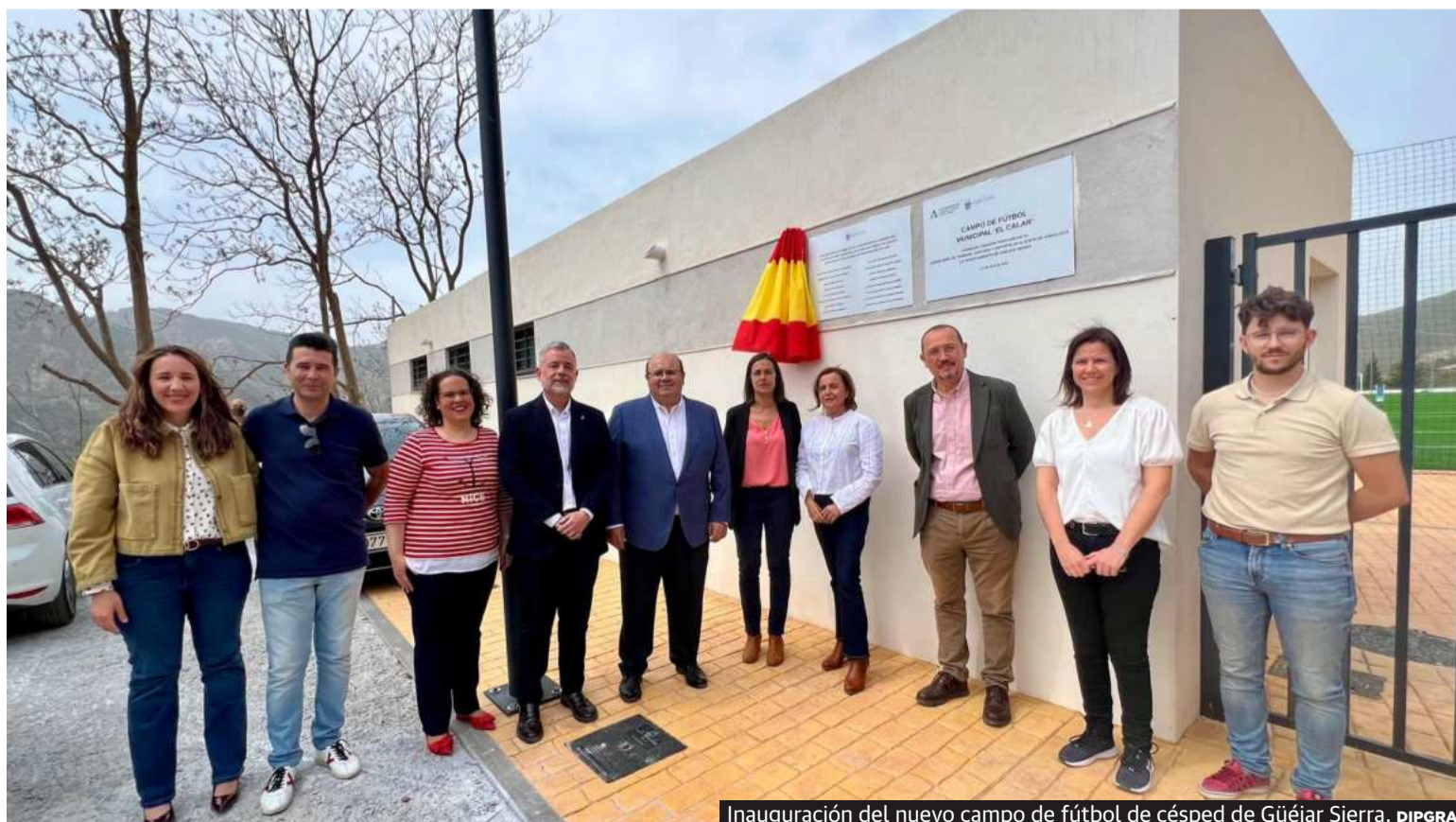
Inauguración del nuevo campo de fútbol de césped de Güéjar Sierra.