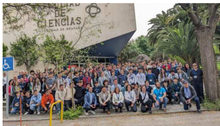
Presentación de las Olimpiadas Nacionales de Física. DIPRA

«Los estudiantes deben disfrutar, compartir experiencias, hablar de los retos que la sociedad afrontará desde la Física en los próximos años», señaló. Asimismo, en Granada se va a construir el acelerador de partículas IFMIF-Dones, «el gran proyecto mundial para generar energía limpia con fusión nuclear», subrayó.