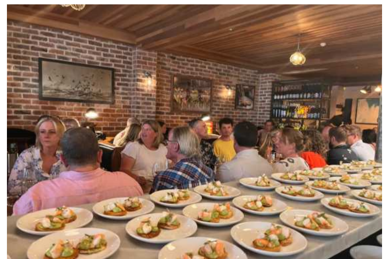
Platos con sabor granadino, servidos en Londres. DIPGRA