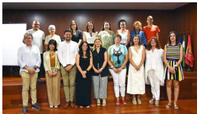
El diputado Roberto González, en el Consejo. DIPGRA.

ción es ser un órgano asesor, de participación y consulta en todas aquellas acciones que incidan en la promoción de la igualdad de oportunidades entre hombres y mujeres, así como un instrumento para animar y potenciar la participación de las mujeres de la comarca en la vida ciudadana y en la coordinación de las políti-