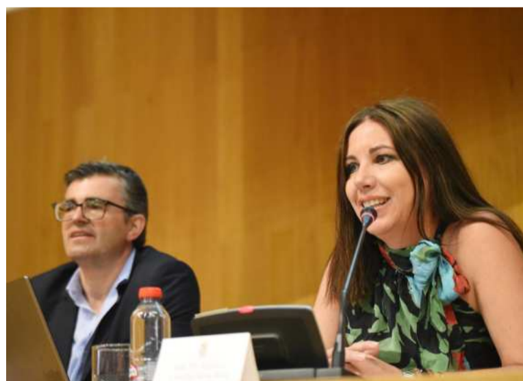
La diputada Mónica Castillo. DIPGRA