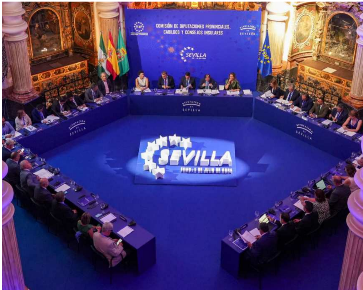
Reunión de las distintas autoridades provinciales en Sevilla.