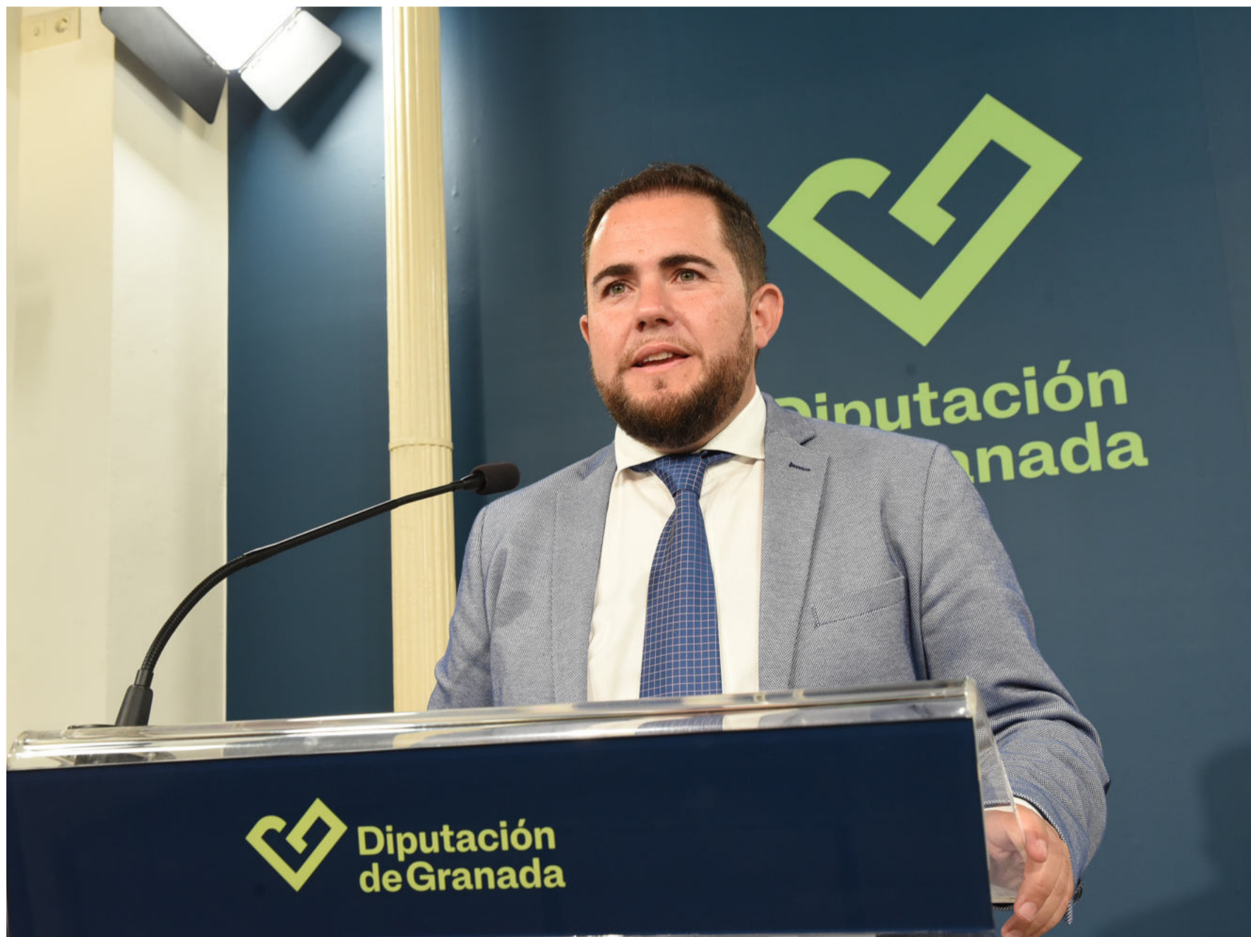
El diputado José Ramón Jiménez, durante su comparecencia para dar a conocer los detalles de la subvención.

[02] Con estas ayudas se garantiza un acceso más seguro y rápido a servicios esenciales para la vida diaria de los ciudadanos, especialmente en áreas rurales, y se contribuye a la cohesión social y desarrollo económico de las comunidades de la provincia.