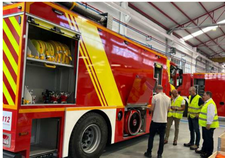
El diputado Eduardo Martos, en un momento de su visita. DIPGRA

Para Martos “es crucial estar al tanto de los avances más recientes en el campo de los servicios de emergencia para poder ofrecer un servicio óptimo y efectivo a los ciudadanos de nuestra provincia”. También “se está estudiando la posibilidad de adquirir dos vehículos de apoyo en grandes intervenciones para fuegos en industrias e incendios forestales. Se trata de dos vehículos nodrizas de 7.000 y 14.000 litros respectivamente. Sería una inversión cercana al millón de euros».