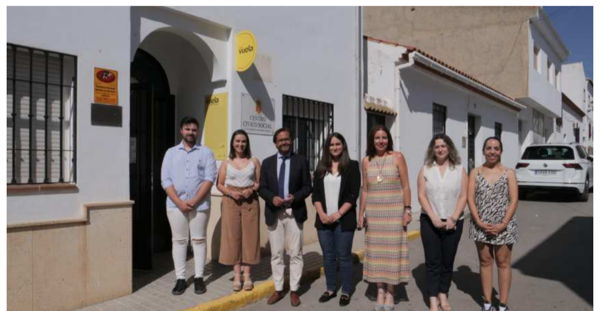
Autoridades y responsables de Punto Vuela, en Torre Cardela.

Los Puntos Vuela, red andaluza para la capacitación digital de personas, profesionales y empresas, tienen como objetivo anali-