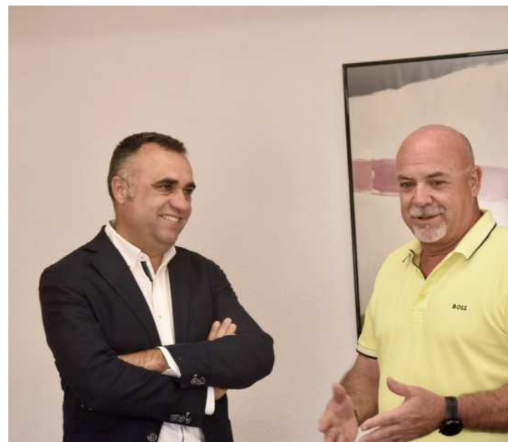
Reunión entre el presidente y el alcalde de Lecrín.

La jornada ha incluido un recorrido por distintas zonas del municipio, en el cual se ha evaluado el estado actual de las infraestructuras y se han discutido las posibles obras y arreglos que podrían llevarse a cabo.