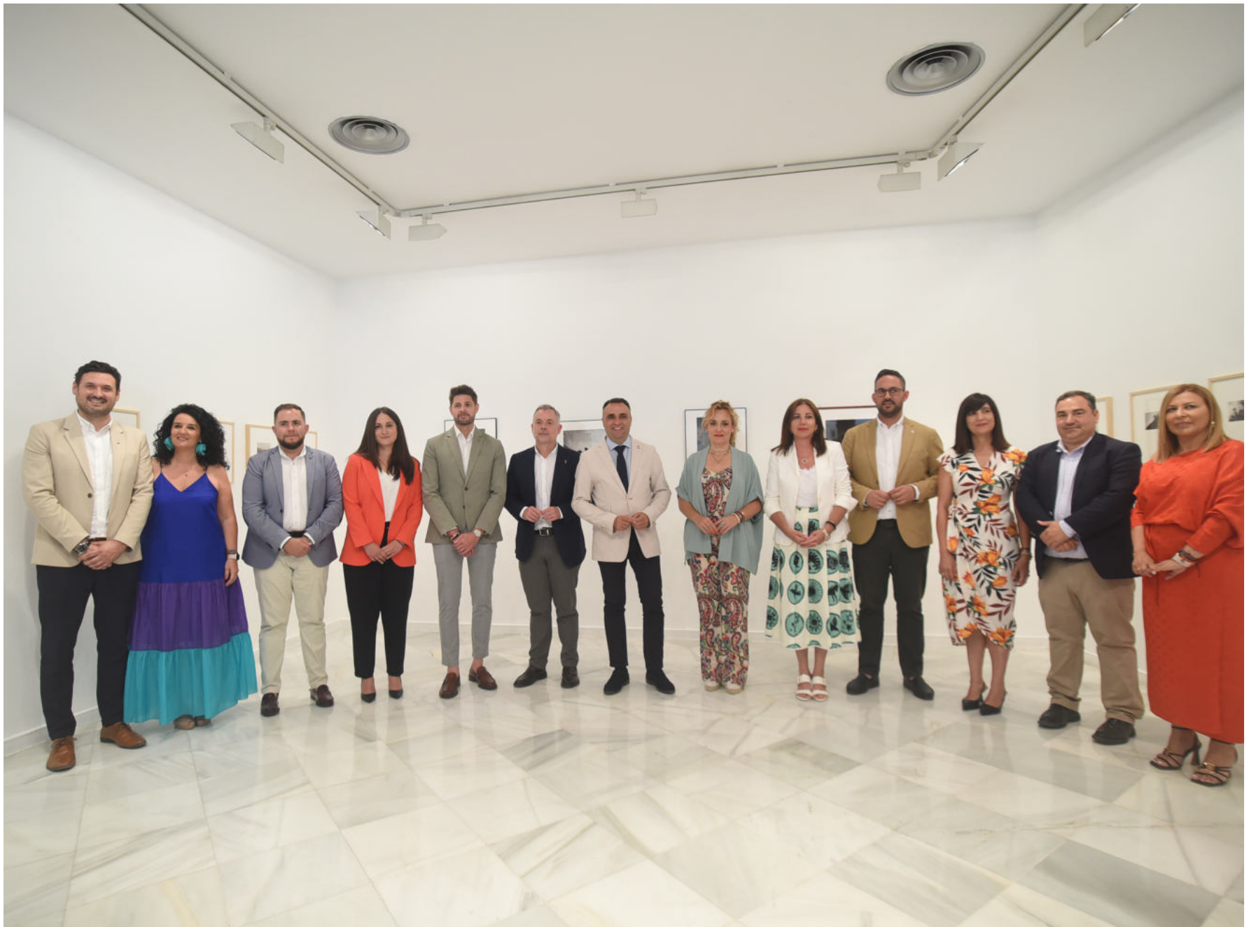
El presidente de la Diputación de Granada, Francis Rodríguez, junto a los miembros de su equipo de Gobierno en el Palacio de los Condes de Gabia.

[02] El presidente de la institución provincial, Francis Rodríguez, ha hecho balance de la gestión realizada en el gobierno de la corporación provincial. Durante su comparecencia ante los medios ha anunciado, también, sus próximos proyectos