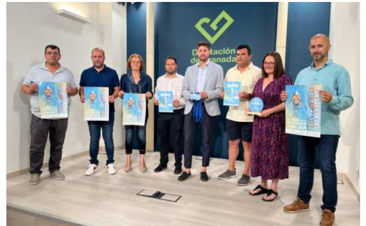
El diputado Eric Escobedo y los representantes de las sedes. DIPGRA

Por último, Vicente Gran, capitán del citado equipo, ha expresado que “la visita a la Diputación es muy importante para nosotros. Al ascender de categoría queremos dar un paso más en ese apoyo y establecer esa sinergia con la institución provincial”.