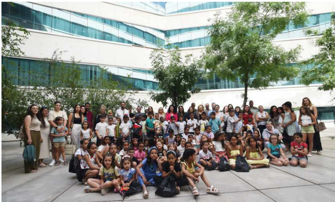
Foto de familia con la diputada Elena Duque, responsables de la asociación y menores saharauis.

La Asociación Granadina de Amistad con la República Árabe Saharaui Democrática lleva años trabajando incansablemente para mejorar la calidad de vida de los refugiados saharauis y esta ayuda permitirá continuar y expandir su labor humanitaria. La colaboración entre la Diputación y la asociación es un ejemplo de cómo las instituciones locales pueden desempeñar un papel crucial en la ayuda internacional, proporcionando recursos y apoyo a las comunidades más desfavorecidas.