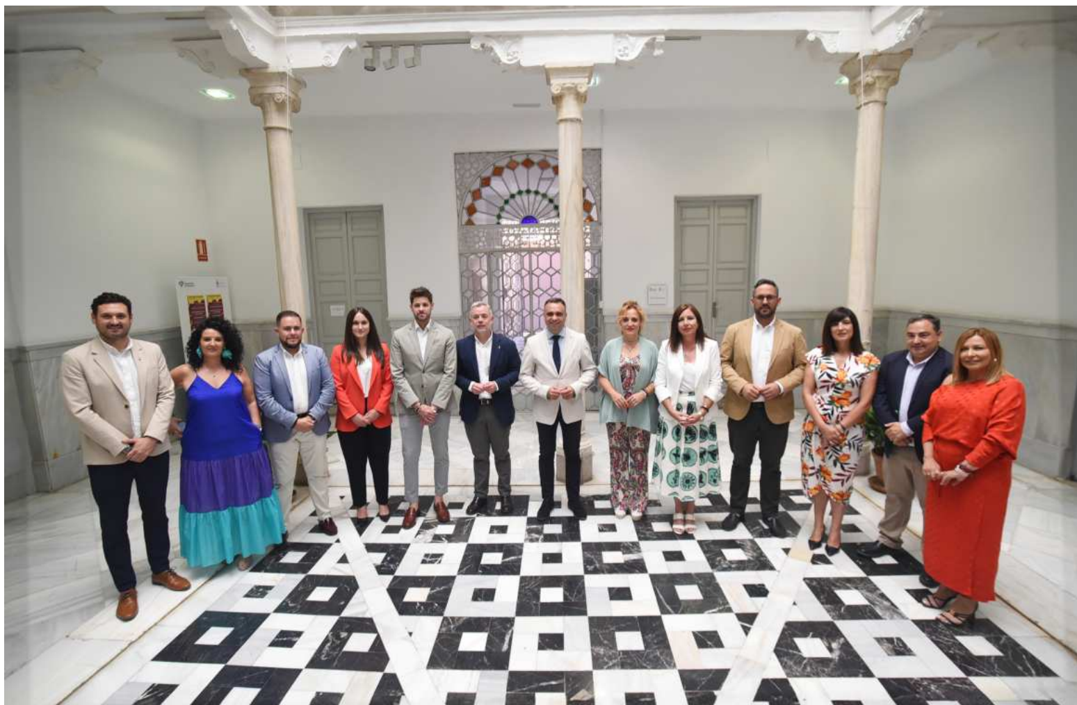
Equipo de gobierno de la corporación municipal. DIPGRA