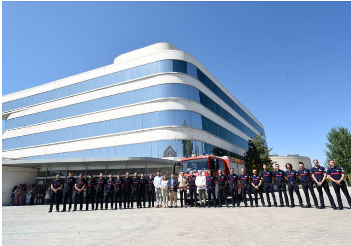
Foto de familia, con las autoridades y bomberos, frente al edificio de la Diputación. DIPGRA

Con su incorporación, «reforzamos nuestra plantilla y también garantizamos una mayor presen-