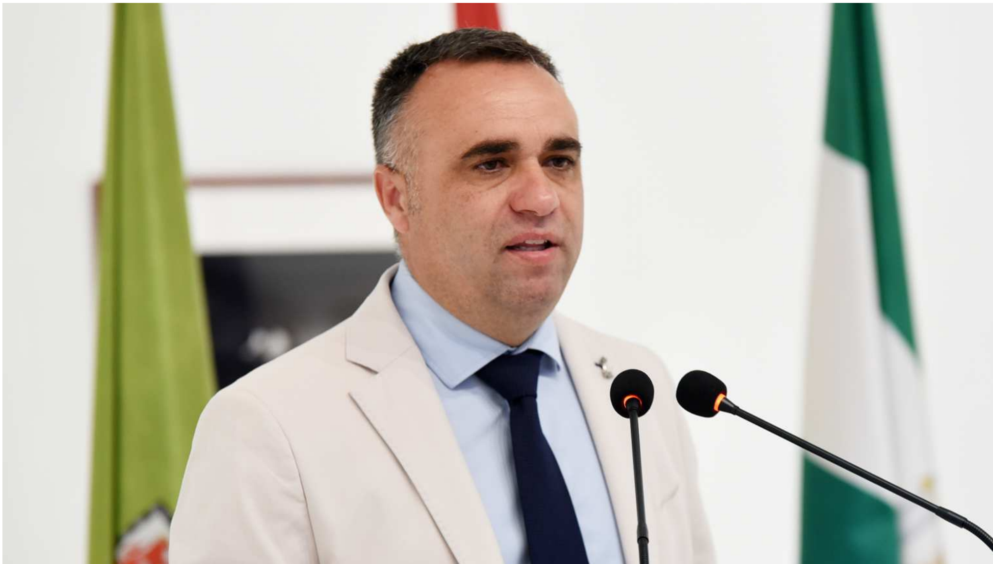
El presidente de la Diputación, Francis Rodríguez, durante su intervención en el Palacio de los Condes de Gábia.

En su comparecencia ante los medios de comunicación el presidente de la institución provincial ha anunciado varios de los proyectos que se ejecutarán en breve