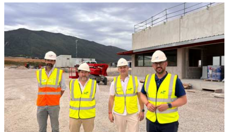
El diputado Antonio Mancilla (derecha), durante su visita.

Antonio Mancilla ha añadido que «la Diputación de Granada sigue comprometida con la innovación y la sostenibilidad, y considera fundamental aprender de proyectos exitosos como el de Montejurra».