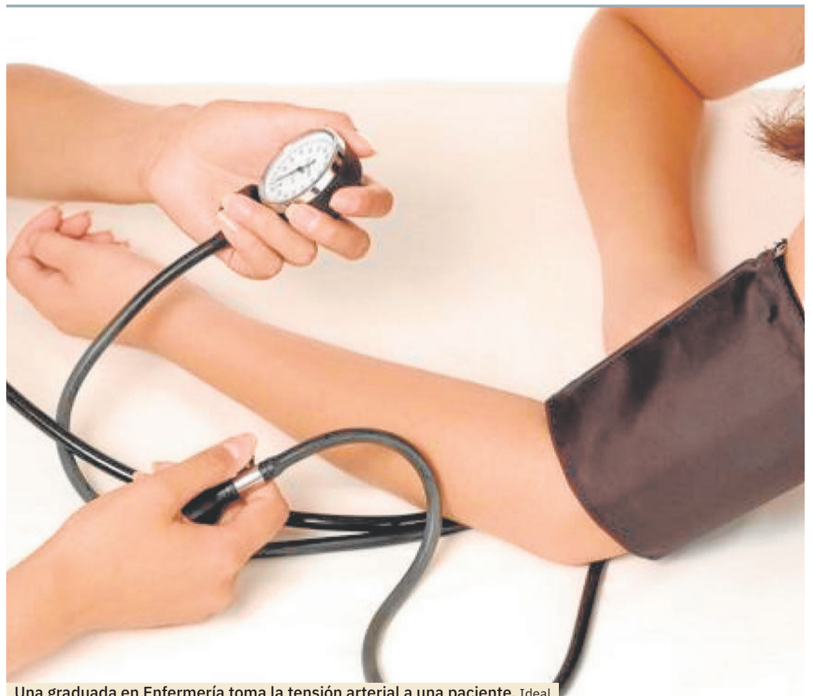
Una graduada en Enfermería toma la tensión arterial a una paciente. Ideal