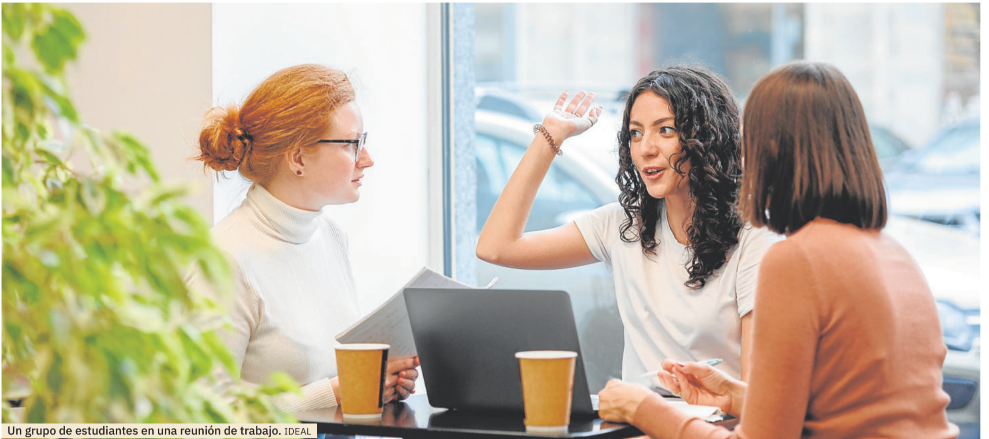
Un grupo de estudiantes en una reunión de trabajo. IDEAL

OPORTUNIDADES. La UGR ha ofertado dentro del programa Erasmus+ 5013 plazas de movilidad