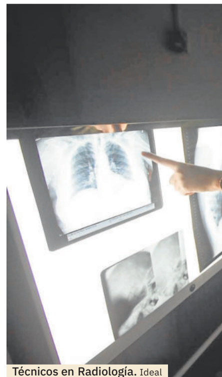
Técnicos en Radiología. Ideal

El sistema universitario español lo conforman en 2023 un total de 93 universidades de las que 51 son Universidades Públicas y 42 son Universidades Privadas. Por lo que respecta a los estudios de Medicina, en solo 15 años, España ha pasado de tener 28 a 55 facultades de Medicina –públicas y privadas– siendo el segundo país del mundo con más facultades para sanitarios por millón de habitantes, sólo superados por Corea del Sur. Esto ha hecho que cada año unas