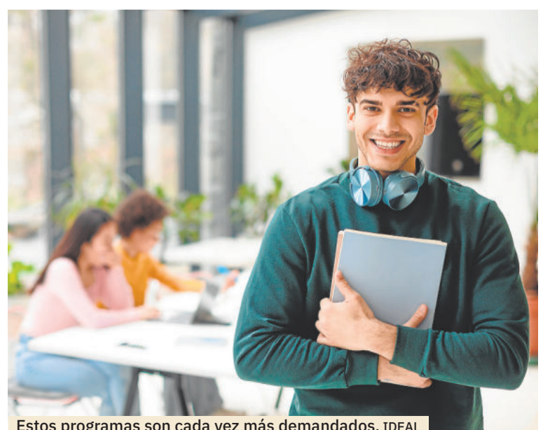
Estos programas son cada vez más demandados. IDEAL