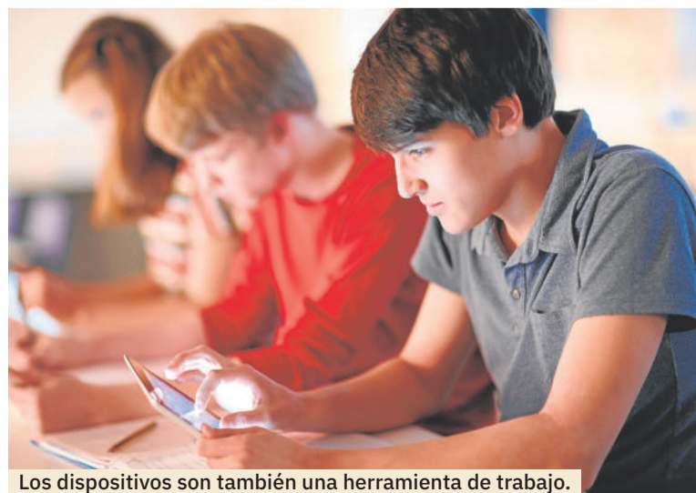
Los dispositivos son también una herramienta de trabajo.

Además, si quieres que tus hijos limiten el uso de la tecnología, dar ejemplo puede ayudarte a conseguir mejores resultados.