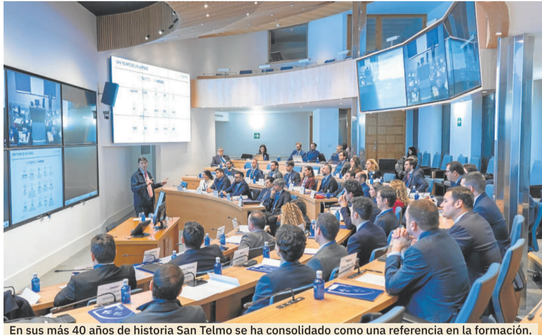
En sus más 40 años de historia San Telmo se ha consolidado como una referencia en la formación.

Los programas académicos se basan en el Método del Caso: casos reales, investigación y pro-