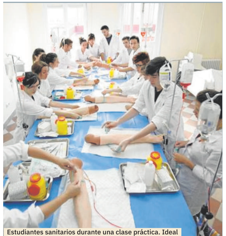
Estudiantes sanitarios durante una clase práctica. Ideal

En Enfermería, la información publicada por las facultades españolas fija la nota de corte más alta en la Universidad de Valencia, Escuela Universitaria de Enfermería La Fe. Este centro ha pedido un 12,87 como mínimo para acceder a los estudios de Enfermería. De cerca le sigue la Universidad de Sevilla, con un 12,54 para acceder a Enferme-