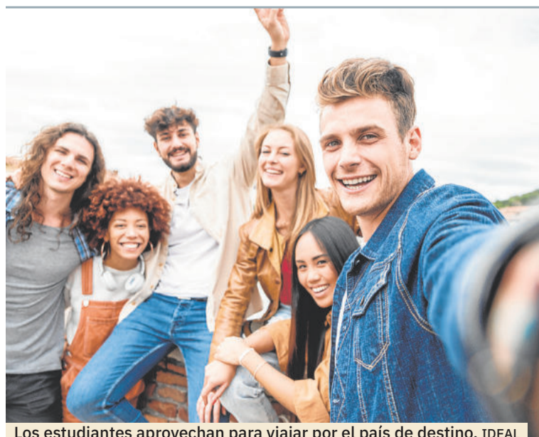
Los estudiantes aprovechan para viajar por el país de destino. IDEAL

Erasmus+ es una oportunidad increíble para crecer y aprender en un entorno internacional. Aprovecha al máximo cada momento y regresa a casa con una mochila llena de recuerdos, amistades y experiencias que te acompañarán toda la vida.