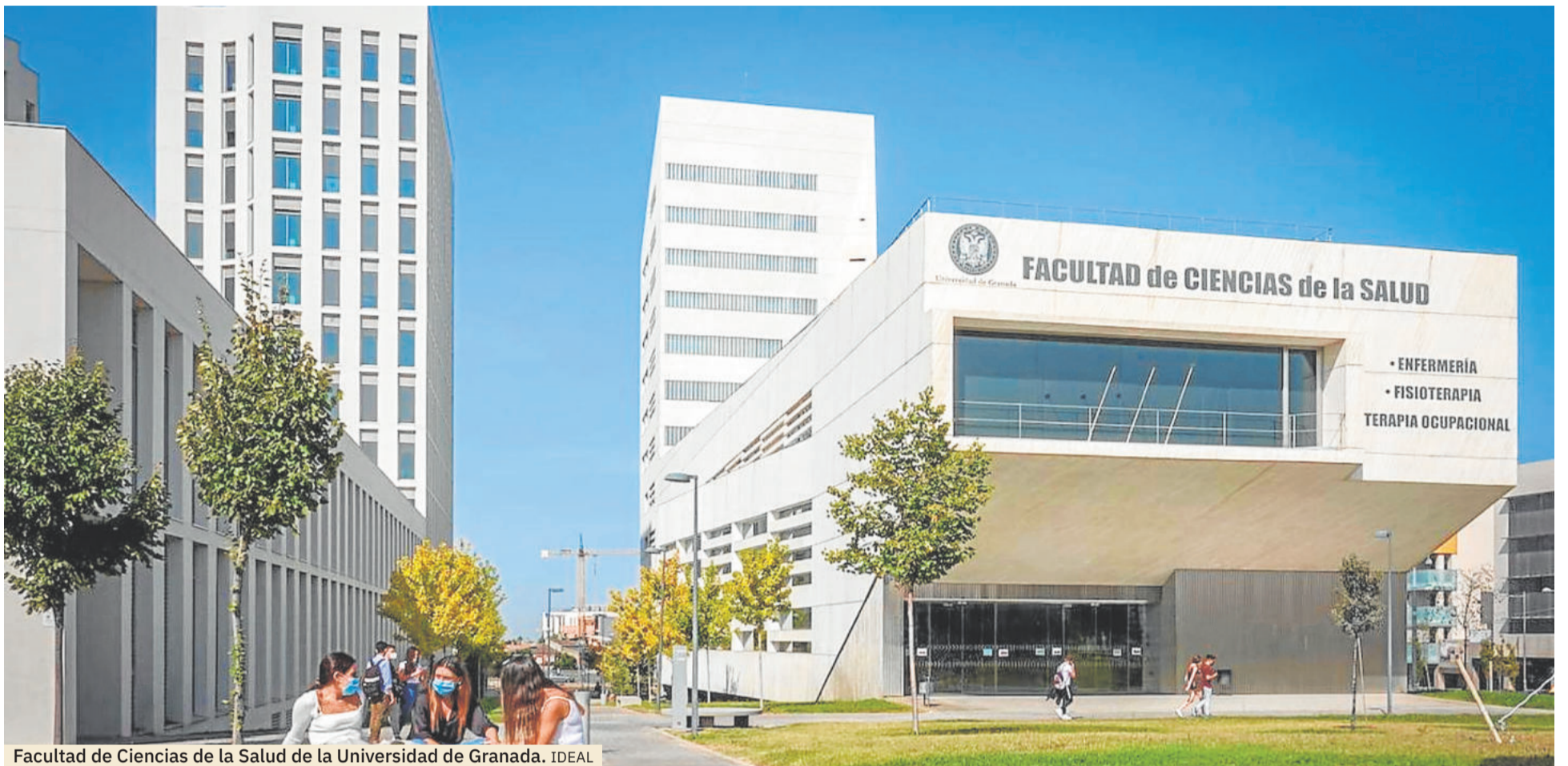
Facultad de Ciencias de la Salud de la Universidad de Granada. IDEAL

FORMACIÓN. La empleabilidad es muy alta en este sector, de ahí, su gran tirón entre los estudiantes