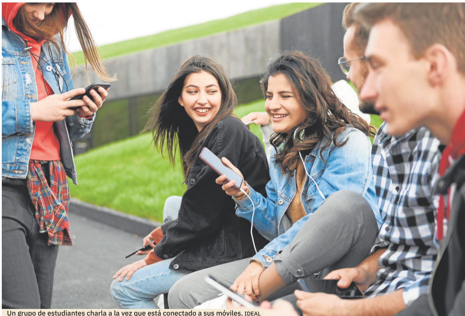
Un grupo de estudiantes charla a la vez que está conectado a sus móviles.

De hecho, existen estudios que alertan de que los niños y jóvenes tienden cada vez más a normalizar esta multitarea. Esto puede afectar sobre su capacidad de atender y concentrarse. Ya que la tecnología afecta a la concentración sostenida. Los estudiantes pueden volverse im-