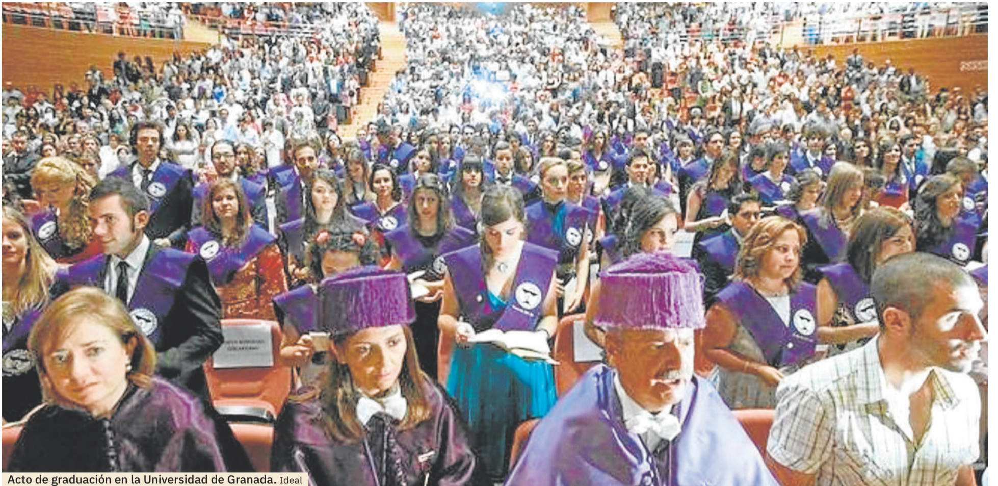
Acto de graduación en la Universidad de Granada. Ideal

FORMACIÓN CONTINUA. A lo largo de la vida profesional es necesario mantenerse actualizados