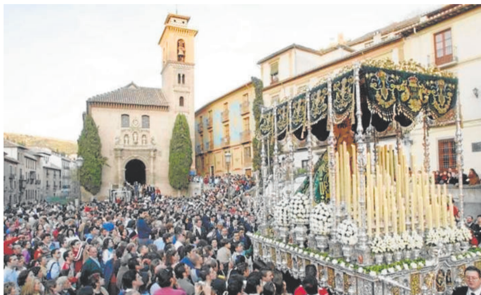
LA ESPERANZA. Martes Santo

podrá contemplarse una composición única y original. La imagen del Señor representa a Jesús tras la Resurrección, con el Banderín de la Victoria en la mano izquierda y la mano derecha en actitud de bendición. La hermandad fue fundada en 1985 y, a lo largo de los años, ha ido cambiando tanto la composición del misterio como el propio paso. Como curiosidad, en la Semana Santa granadina hay dos cofradías de la Resurrección.