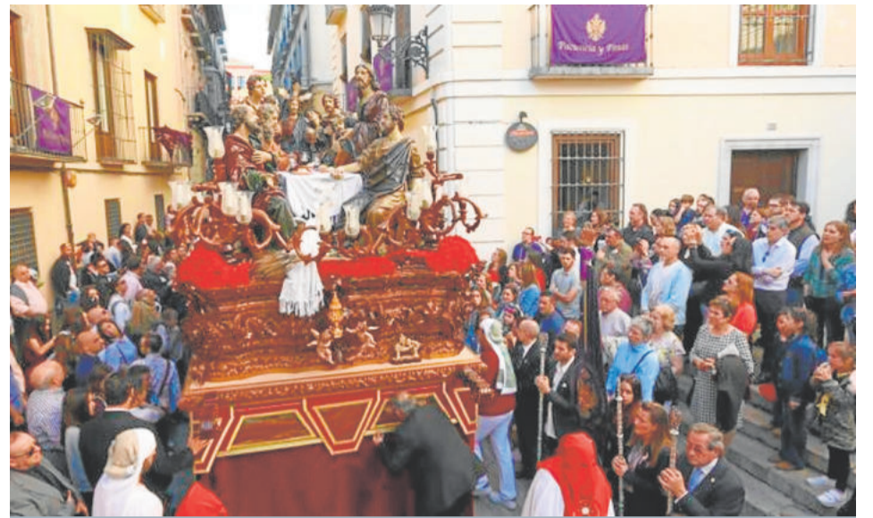
SANTA CENA. Domingo de Ramos

netamente granadinos como el membrillo, el caqui, las granadas), flores y tallos, grandes hojas de acanto, columnas salomónicas, elementos arquitectónicos... se reparten por todo el paso, uno de los más ricos y ornamentados de la Semana Santa. Además, el programa iconográfico, de gran simbolismo, tiene una fuerte carga catequética. Es tradición que lleve un exorno floral compuesto por plantas y flores silvestres, simulando el sagrado huerto.