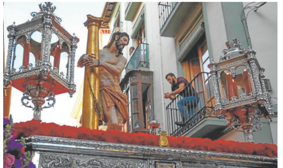
PACIENCIA Y PENAS. Miércoles Santo

lio Reyes. La canastilla y los candelabros de guardabrisas son obras de Francisco Pineda. Los faldones son de terciopelo granate y es uno de los pasos de la Semana Santa granadina que más pesa. Como dato curioso, tanto los panes como la demás comida que aparece sobre la mesa son reales. La hermandad fue fundada en el año 1926 y este paso de misterio se caracteriza, desde hace años, por el buen andar de sus costaleros.