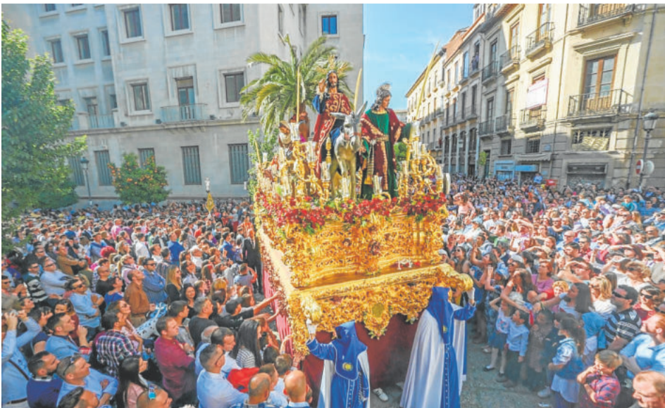
LA 'BORRIQUILLA'. Domingo de Ramos