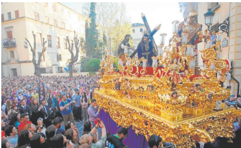
TRES CAÍDAS. Miércoles Santo