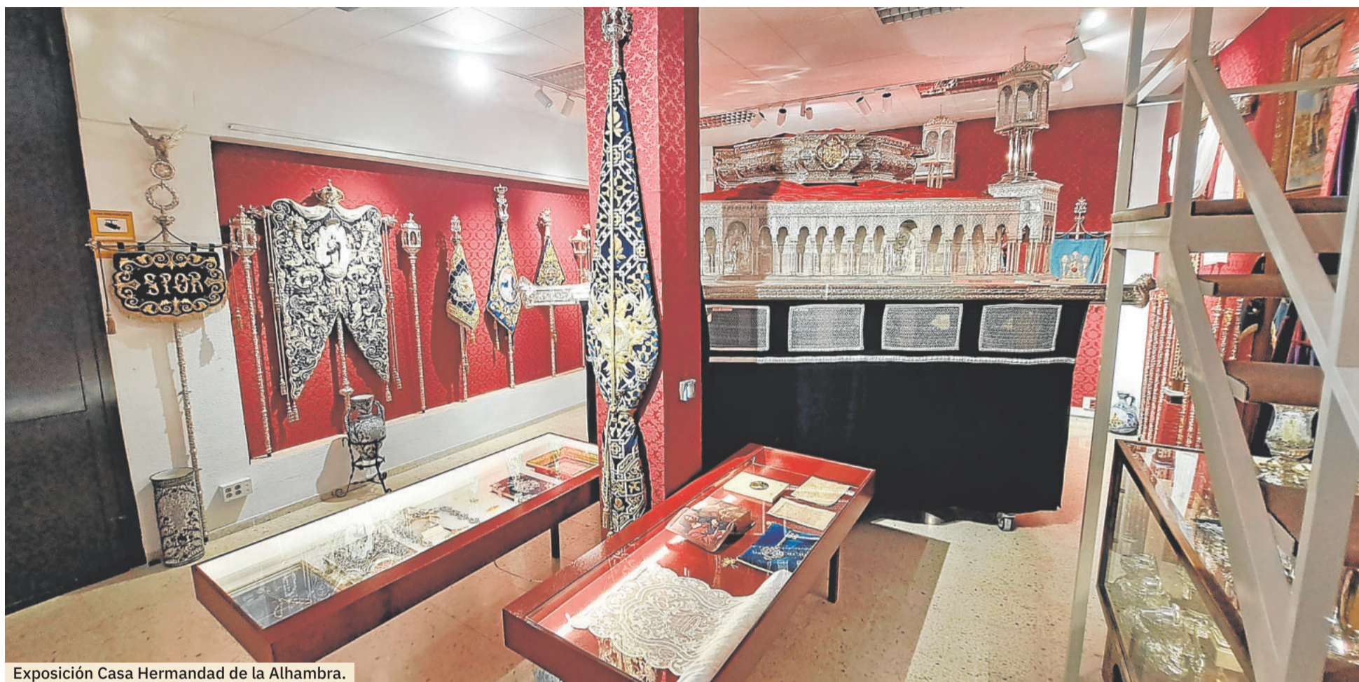
Exposición Casa Hermandad de la Alhambra.

EXPOSICIONES. El monasterio de San Bernardo, San Juan de los Reyes o la casa de hermandad de San Agustín, 'subsedes' culturales