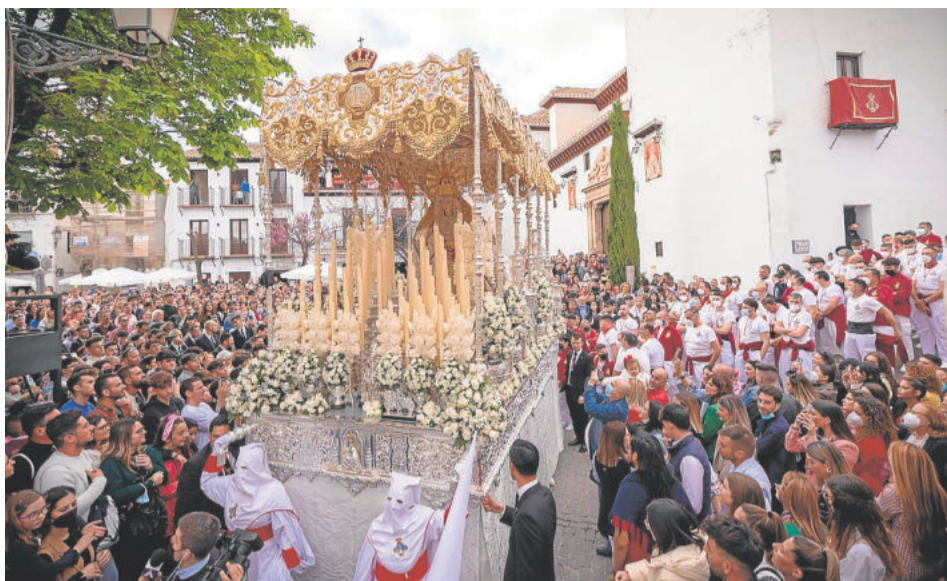
AURORA. Jueves Santo