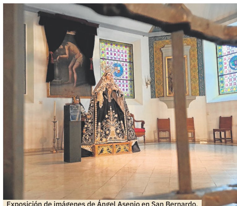
Exposición de imágenes de Ángel Asenjo en San Bernardo.