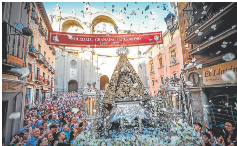
SOLEDAD. Viernes Santo

a Cristo Crucificado, segundos antes de morir, suspendido de cruz arbórea por tres clavos. De canon algo largado, con paño de pureza voluminoso, resuelto a grandes pliegues muy simplificados y anudado a la derecha. El crucificado se presenta sobre un bello paso cuya ebanistería es de José Jiménez Batista, la talla de Julián Sánchez, el dorado de Cecilio Reyes y la imaginería que lo completa de Ángel Asenjo. El resultado artístico, fabuloso.