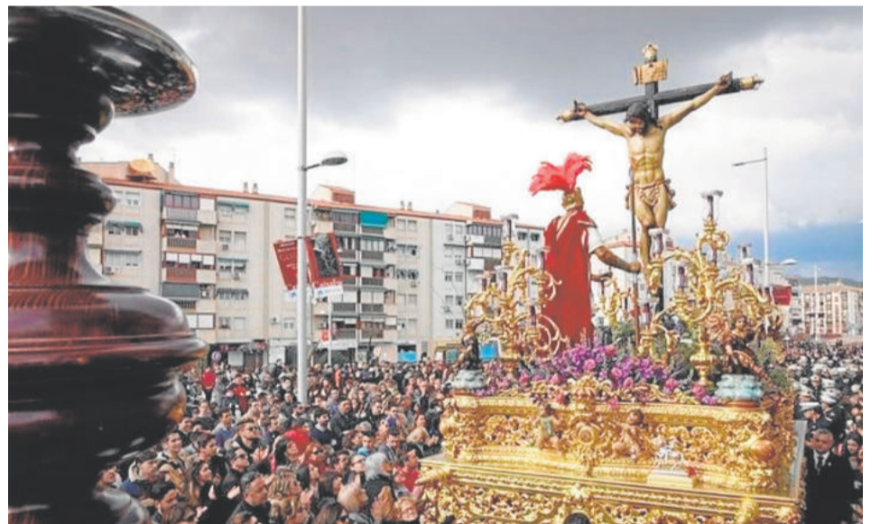
LA LANZADA. Martes Santo

zando la talla en el año 2001 y siendo dorado por el taller granadino de Cecilio Reyes. De sinuosas formas barrocas, mezcla en canasto y respiraderos elementos arquitectónicos con detalles vegetales y hojarasca barrocas, destacando las grandes dimensiones del mismo, y la altura que llegan a alcanzar los candelabros de guardabrisas. El paso se completa con numerosa imaginería realizada por el artista cordobés José Antonio Cabello.