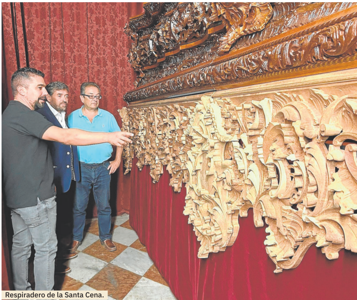
Respiradero de la Santa Cena.

imagen de Jesús de la Meditación, de la hermandad de los Estudiantes (Universitaria) con el nimbo y la corona de espinas en orfebrería, que se bendijo en el último triduo pascual y que sin embargo se ha preferido dejar como estreno en esta ocasión singular. Además, la imagen llevará a sus pies asida a la túnica que se representa sobre la roca, la medalla de concejal del Ayunta-