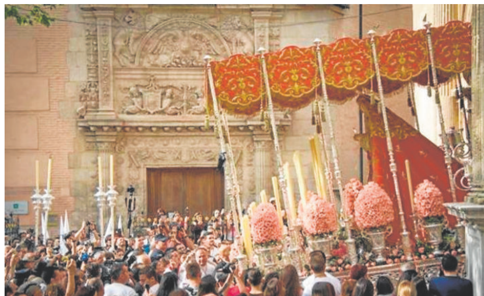
LOS DOLORES. Lunes Santo

ginería granadina realizada por el inigualable José de Mora (S. XVII). Sus manos aparecen maniatadas entre sí y al cuello con un cordel natural entrelazado. El peso del cuerpo recae sobre la pierna derecha, presentando la izquierda ligeramente flexionada. Las imágenes secundarias van a ser sustituidas próximamente. El escultor malagueño Israel Cornejo va a ser el encargado de su realización, proyecto que espera ver la luz en un futuro muy próximo.