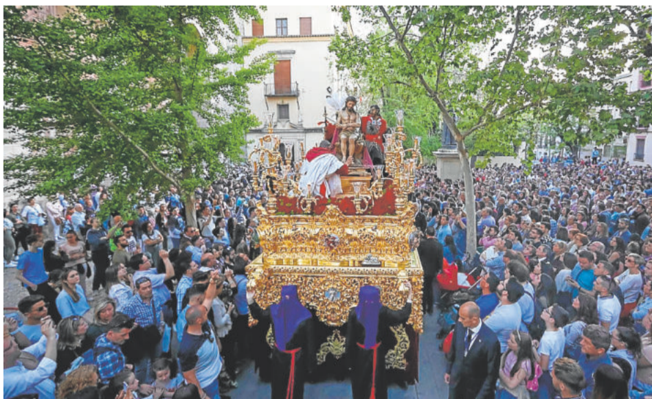
LA CAÑILLA. Martes Santo