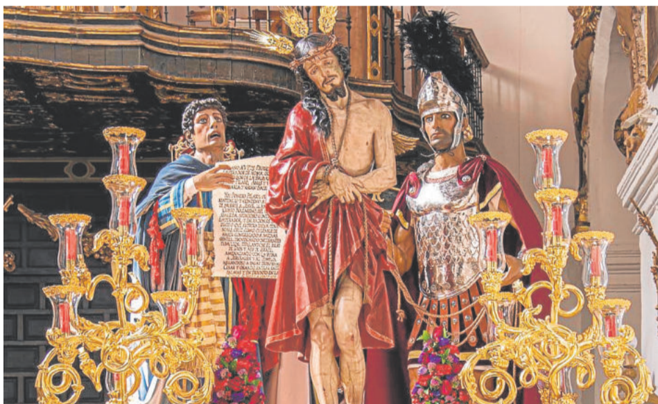
SENTENCIA Y MARAVILLAS. Domingo de Ramos

jarascas y granadas, sin faltar cartelas talladas. La iconografía del paso ronda alrededor de los santos, personajes y escenas bíblicas relacionadas con la vida de Jesús. Se completa el misterio con un romano portando lanza que vigila la acción, de talla completa sobrevestida, un sayón de duras facciones y bizzo (ambos obra de Eduardo Espinosa Cuadros del año 1927), un miembro del Sanedrín y un sayón inclinado haciendo burla (obra de Ángel Asenjo).