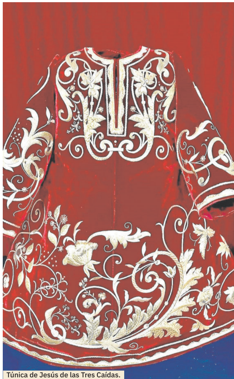
Túnica de Jesús de las Tres Caídas.

Por delante de la imagen de la Virgen de la Esperanza en su paso de palio verde irá el misterio de la Resurrección, de la parroquia de San Miguel Arcángel. En él podremos observar el detalle de reverencia que muestra la imagen de Santa María Magdalena del paso del Cristo de la Buena Muerte que ha sido cedida para esta salida de octubre. Ha