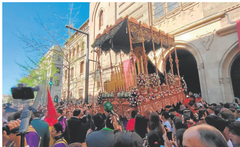
LOS GITANOS. Miércoles Santo

presenta con corona de espinas con nimbo, en plata. En la actualidad el misterio lo forman, en igual disposición al original del s. XVII, esculturas del imaginero Antonio Bernal, procesionando sobre paso de madera en estilo barroco de la firma de Guzmán Bejarano y sobredorado por Cecilio Reyes. El Señor recibe culto todo el año en un convento albaicinerero, desde donde se traslada, antes de su salida procesional, hasta la sede canónica del barrio del Realejo.