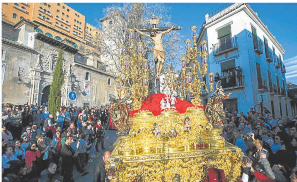
FAVORES. Viernes Santo

su nombre a la celebración, en el año de su fundación, del Año Santo de la Redención. Para hacer la imagen, el escultor se basó en la del Cristo de la Noche Oscura de Úbeda, procesionando sobre un bello paso de madera caoba, diseñado y tallado en los talleres de Manuel Guzmán Bejarano en la primera década del siglo actual. De diseño barroco, destacan sus seis candelabros de guardabrisa, con una altura considerable.