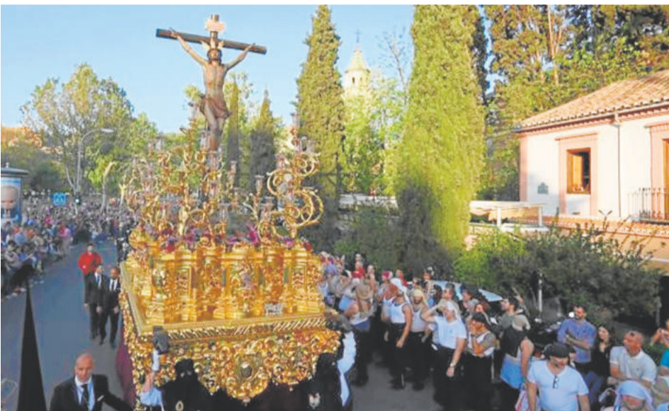
LOS ESCOLAPIOS. Viernes Santo

lación y la sangre que brota de ellas. Se desconoce su autor, estando realizada la imagen hacia 1640. Procesa en un paso dorado (adaptación del paso que perteneciera a la cofradía de la Aurora), figurando además en el mismo las imágenes de los dos ladrones que fueron crucificados junto a Cristo, siendo estos obra del malagueño Israel Cornejo en 2013. El paso está realizado en madera tallada y dorada de estilo neobarroco.