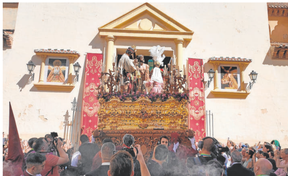
TRABAJO Y LUZ. Lunes Santo

lleres de Hermanos Caballero y posteriormente dorado. Está iluminado por guardabrisas. La imagen de Nuestro Padre Jesús de la Pasión data del año 1984, destacando su poderosa zancada mientras gira la cabeza a la derecha y hacia abajo. Tiene una expresión de dolor confundida con perdón y dulzura. Tiene una espina que le parte la ceja izquierda. Se presenta con corona de espinas y potencias. La hermandad fue fundada en el año 1979.