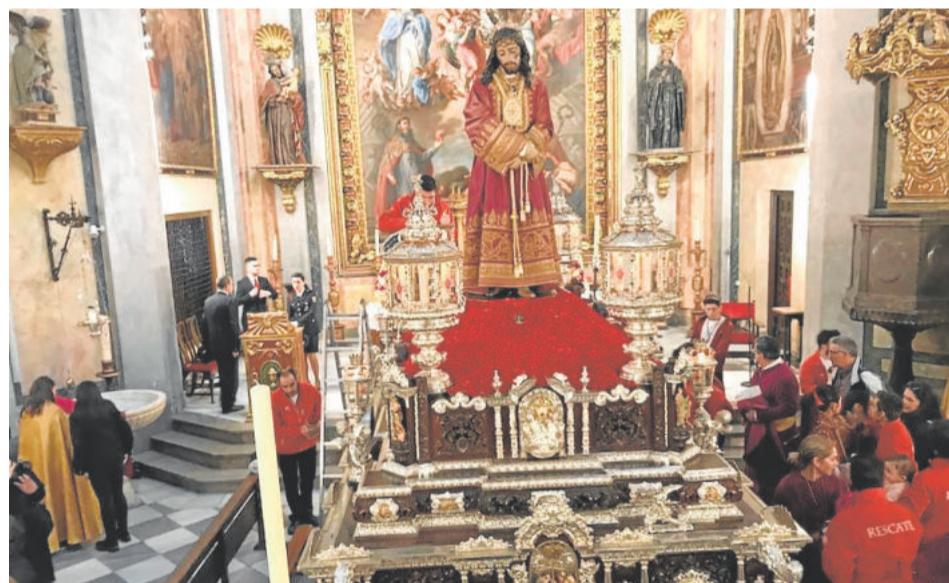
EL RESCATE. Lunes Santo

to y un rosario. Mirada baja y ojos entrecerrados, girando el rostro muy levemente hacia la derecha. La imagen va tocada tradicionalmente con un rostrillo recogido y poco ampuloso, rematándose con diadema en un lugar de corona. En el pecho lleva siempre el escudo del Tercio que la erigió como titular de la cofradía. El granadino Aurelio López Azaustre la realizó en 1962. Es de las pocas cofradías que procesionan solo un paso.