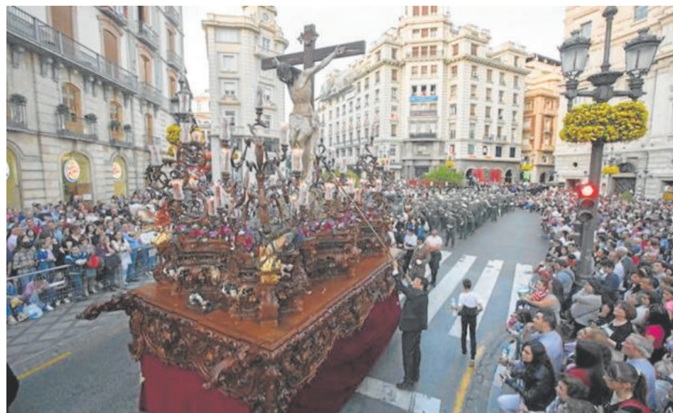
SALESIANOS. Jueves Santo