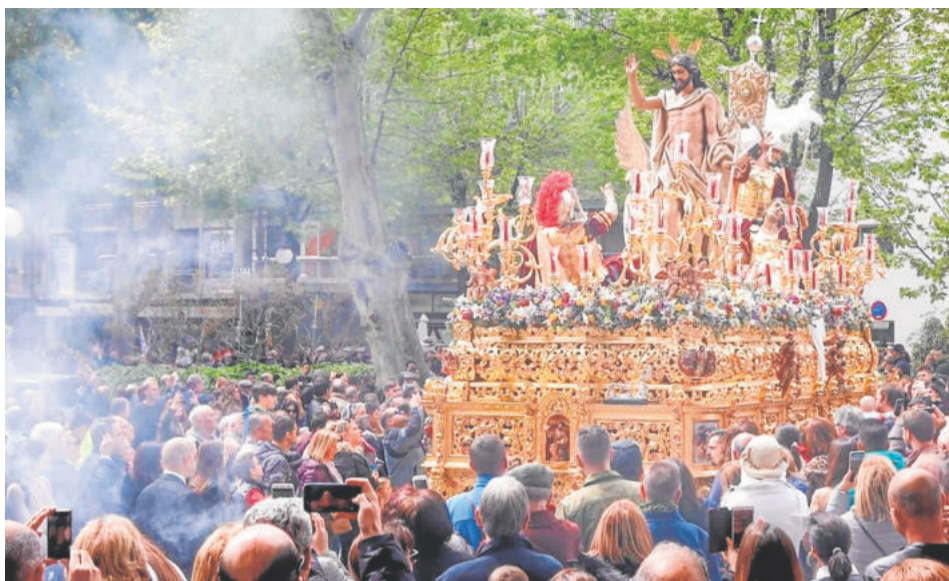
RESURRECCIÓN Y TRIUNFO. Domingo de Resurrección