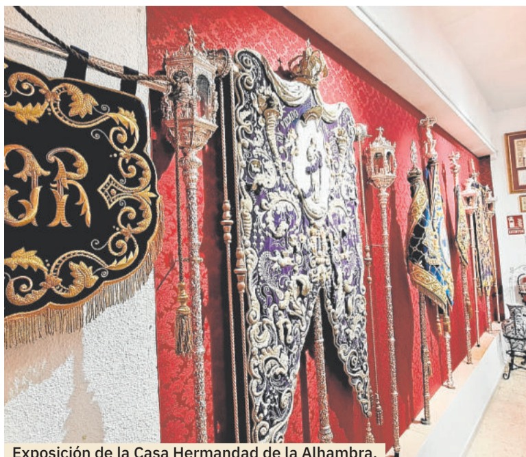
Exposición de la Casa Hermandad de la Alhambra.