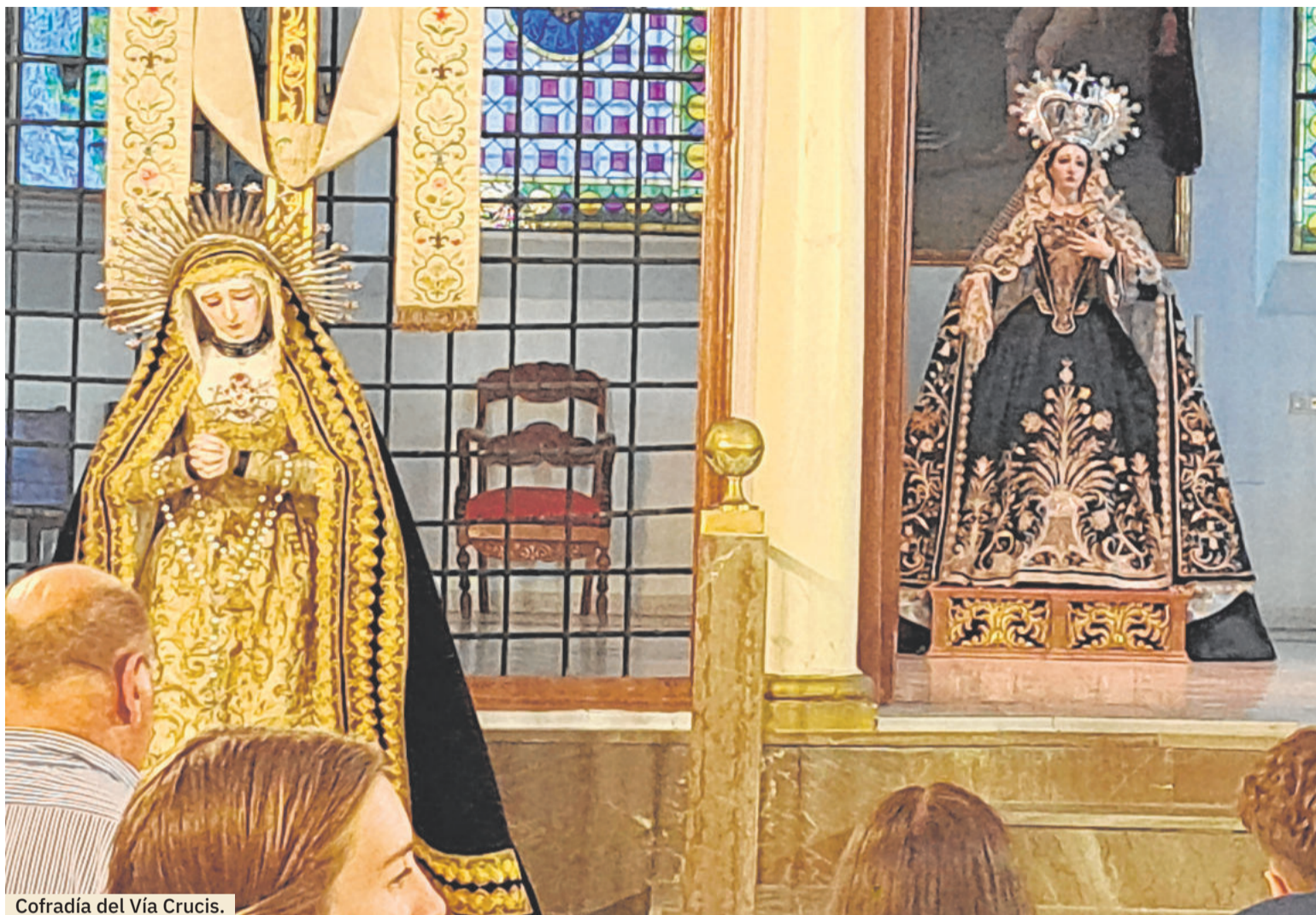
Cofradía del Vía Crucis.

Viaje en el tiempo con la Cofradía de la Borriquilla el viernes 13 y sábado 14 por el Albaicín Bajo. Visita para grupos