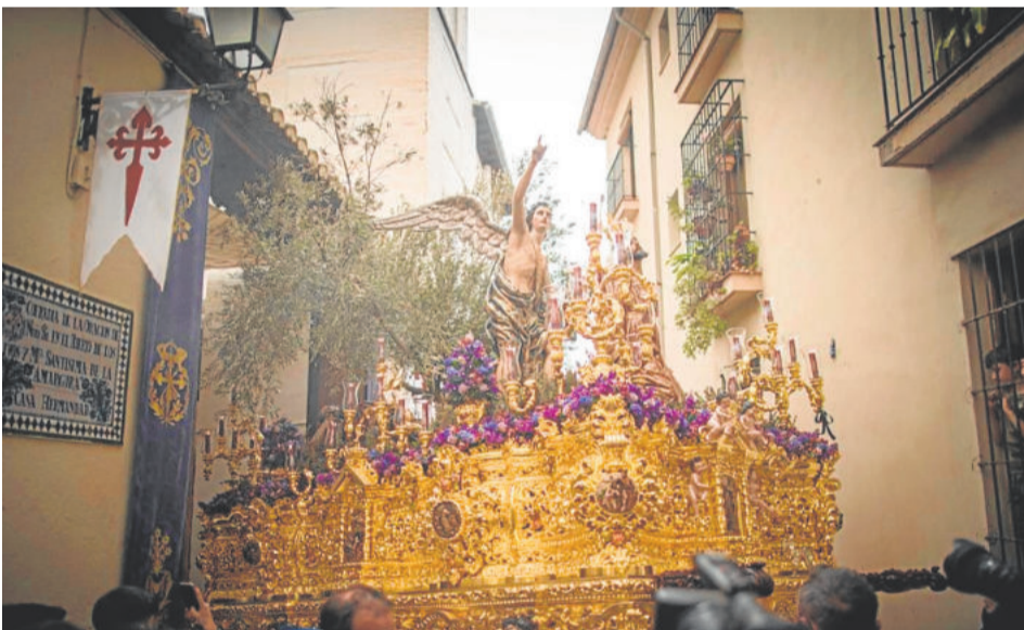
EL HUERTO. Lunes Santo