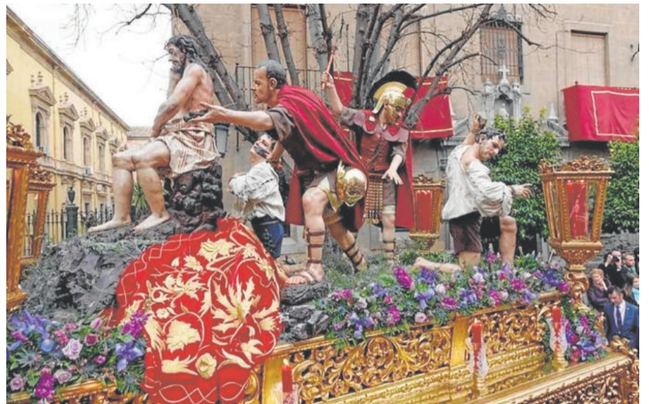
ESTUDIANTES. Miércoles Santo