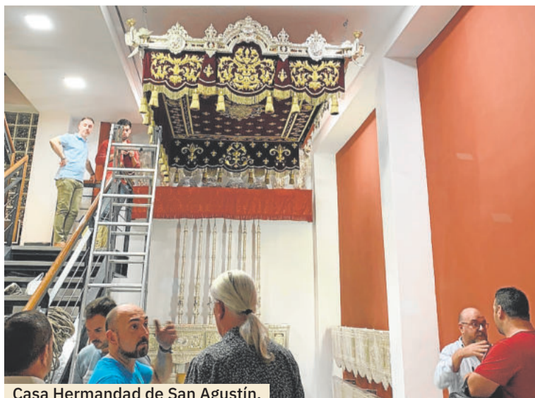
Casa Hermandad de San Agustín.

Cuatro grandes hitos coinciden con la cruz de guía de la cofradía que abre el cortejo de la hermandad en la calle cada Martes Santo. Estarán además, los tres titulares que se venera: el libro del Santo Vía Crucis, en cuyo interior se conserva el rezo que cada año se realiza por la Carrera del Darro, ya de regreso las cofradías; Jesús de la Amargura y Nuestra Señora de los Reyes. En torno a todos ellos, se ha trazado un discurso catequético y artístico en el que figuran piezas destacadas del patrimonio de la