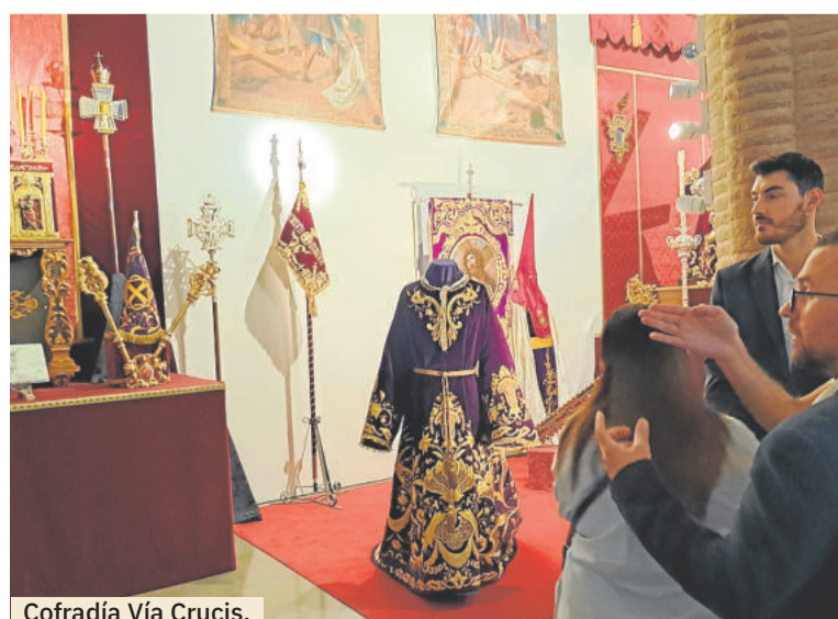
Cofradía Vía Crucis.

El primer eslabón de esta cadena de citas cofrades culturales y religiosas está en el templo de San Bernardo