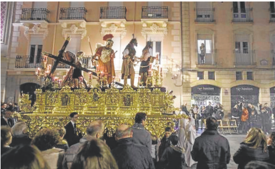
EL DESPOJADO. Domingo de Ramos