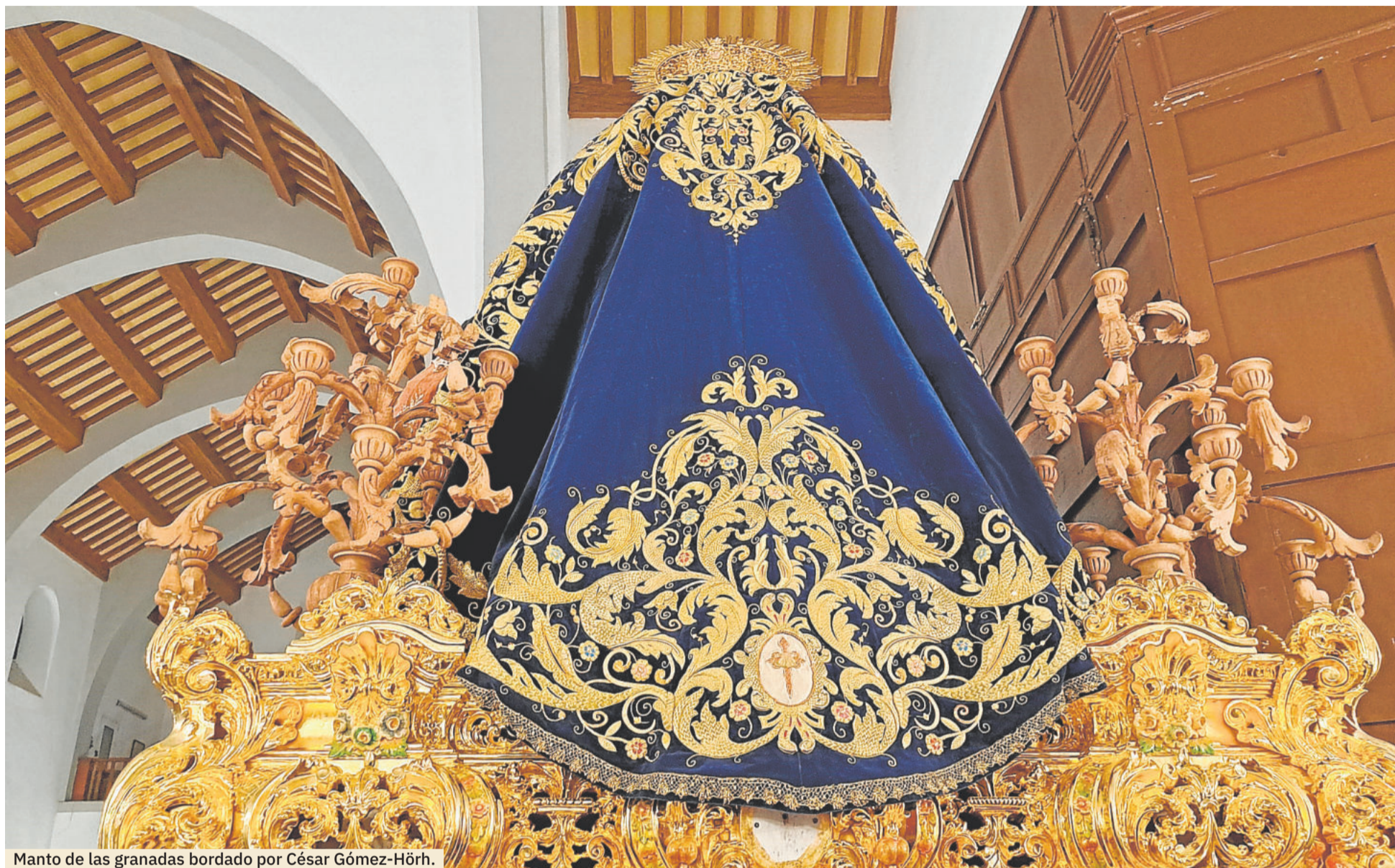
Manto de las granadas bordado por César Gómez-Hörh.

MAGNA. La nueva túnica de Jesús de las Tres Caídas, respiradero de la Santa Cena y algunos cambios en pasos son las principales novedades de este evento