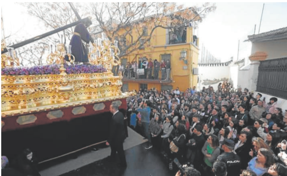
PASIÓN Y ESTRELLA. Jueves Santo