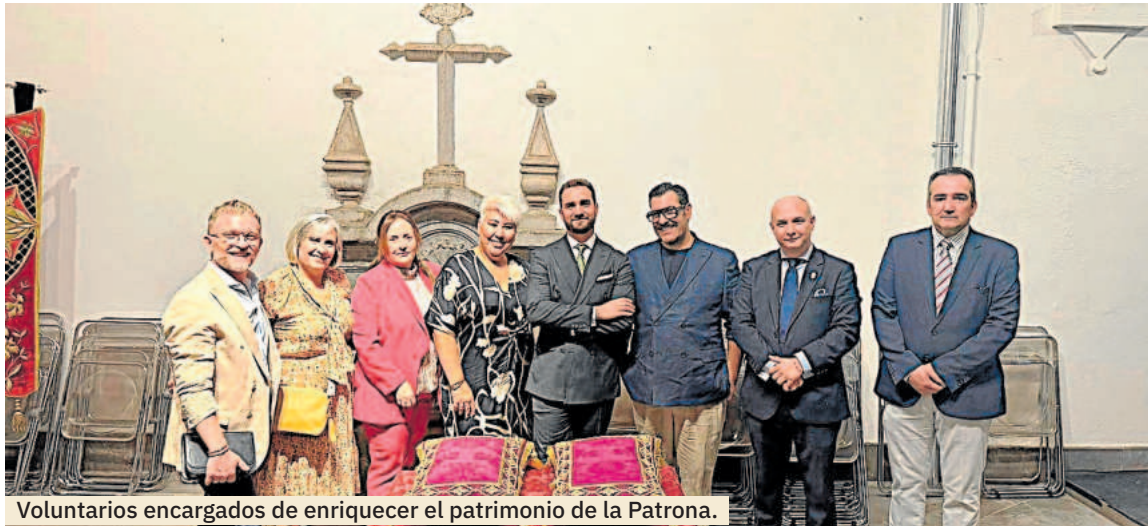
Voluntarios encargados de enriquecer el patrimonio de la Patrona.