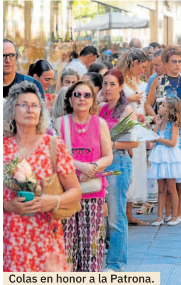
Colas en honor a la Patrona.

Sin embargo, la ofrenda, con esos más de veinte mil ramos de flores son un impulso al comienzo del curso para muchos negocios de floris-