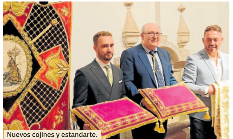
Nuevos cojines y estandarte.