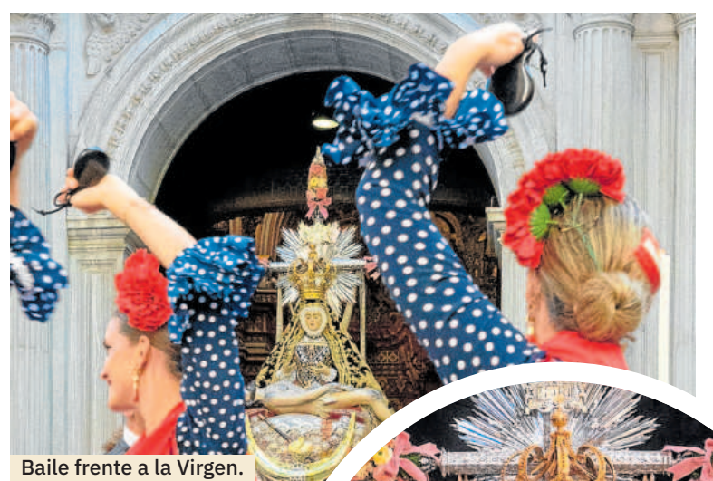
Baile frente a la Virgen.