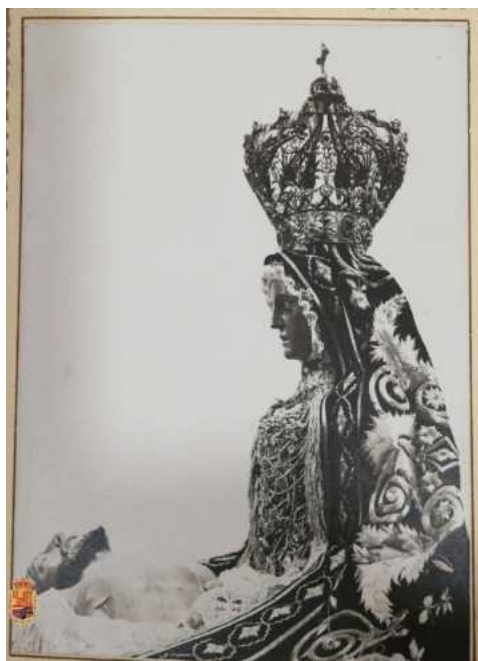
La Virgen de las Angustias, en una imagen antigua.

La hermandad portaba dos imágenes, Cristo Crucificado y la Vir-