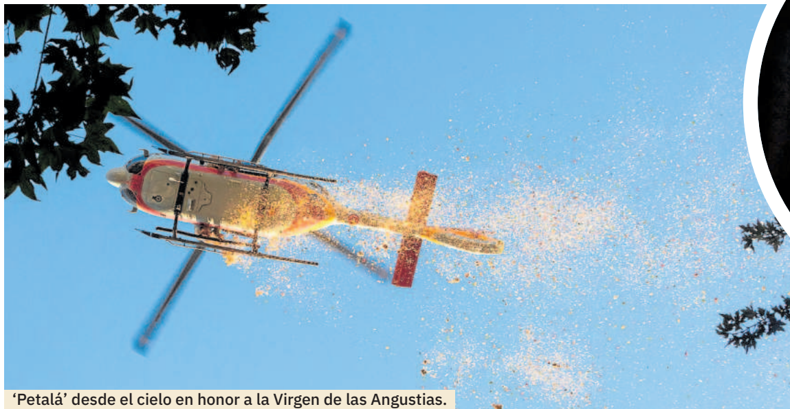
'Petalá' desde el cielo en honor a la Virgen de las Angustias.