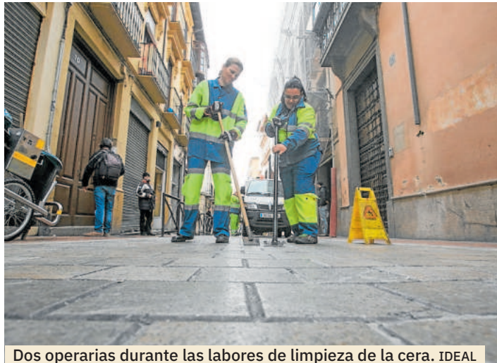
Dos operarias durante las labores de limpieza de la cera.

C. S. El Ayuntamiento de Granada, a través de la empresa concesionaria Inagra, ultima los preparativos de limpieza y recogida de residuos con motivo de la festividad de la Virgen de las Angustias, patrona de la ciudad. La cita, que cada año congrega a miles de granadinos y visitantes en torno a la tradicional ofrenda floral que se celebró el pasado día 15, contando con un refuerzo de limpieza de 20 operarios y el próximo domingo, día 28, la solemne procesión que contará con un dis-