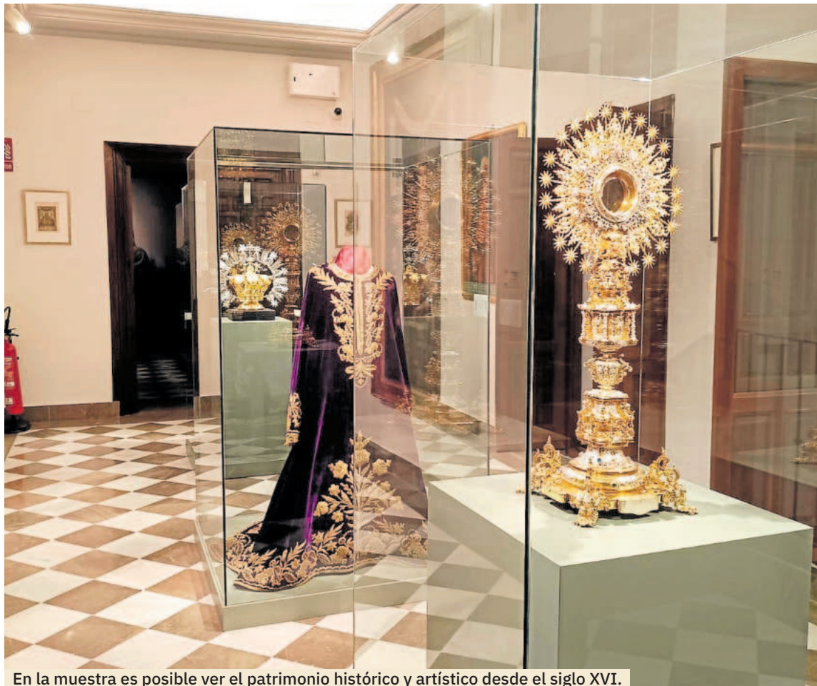
En la muestra es posible ver el patrimonio histórico y artístico desde el siglo XVI.

El acceso al Tesoro de la Virgen se hace a través de su tienda oficial, justo al lado de la puerta principal de la Basílica. En este espacio se encontraban las antiguas dependencias del hospital y actualmente toda una selección de preciosos artículos inspirados en la