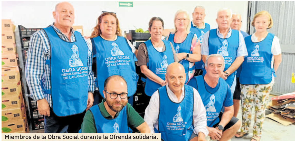
Miembros de la Obra Social durante la Ofrenda solidaria.