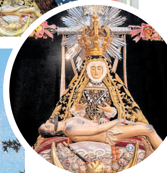
Granada ya espera a la Patrona.

La cuadragésimo cuarta edición de la ofrenda floral a Nuestra Señora de las Angustias fue todo un éxito de participación