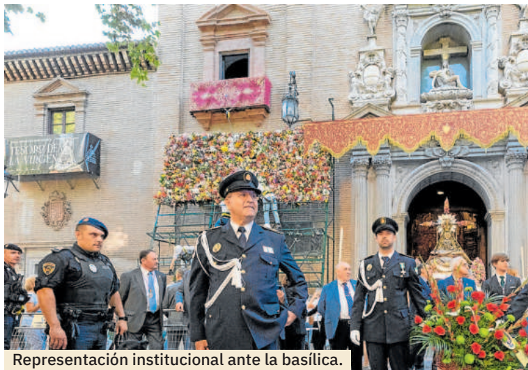
Representación institucional ante la basílica.