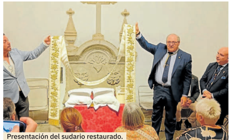
Presentación del sudario restaurado.