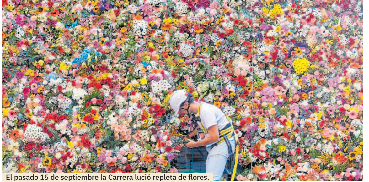
El pasado 15 de septiembre la Carrera lució repleta de flores.