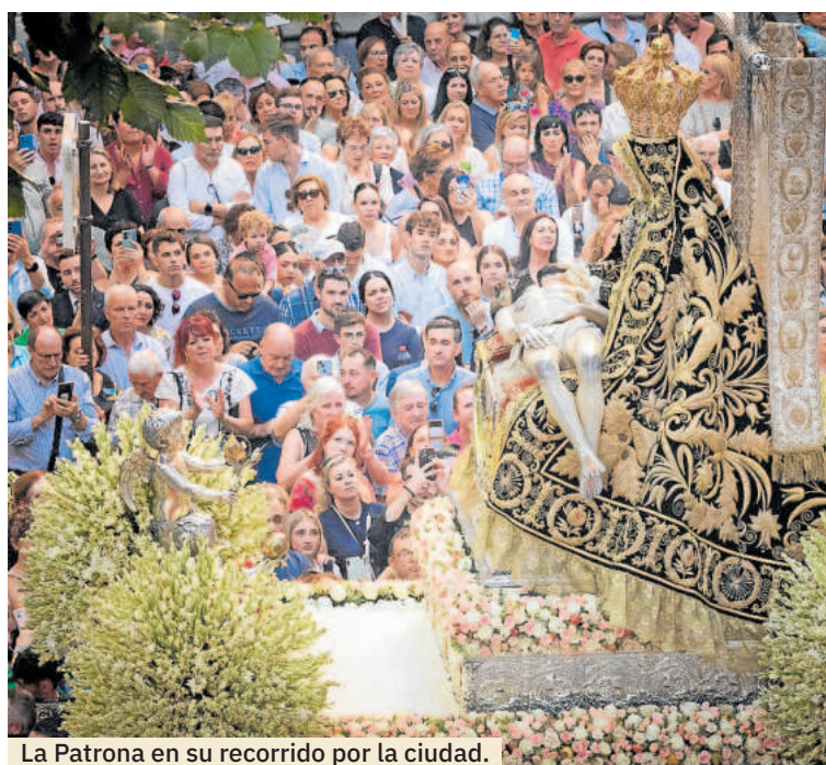
La Patrona en su recorrido por la ciudad.

Tras la Asociación de las Damas del Pilar desfilarán las representa-