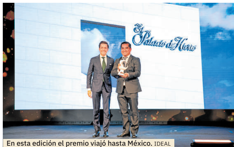
En esta edición el premio viajó hasta México. IDEAL

Esta propuesta ofrece bajo mantenimiento, belleza natural y una integración coherente entre diseño arquitectónico y funcionalidad constructiva.