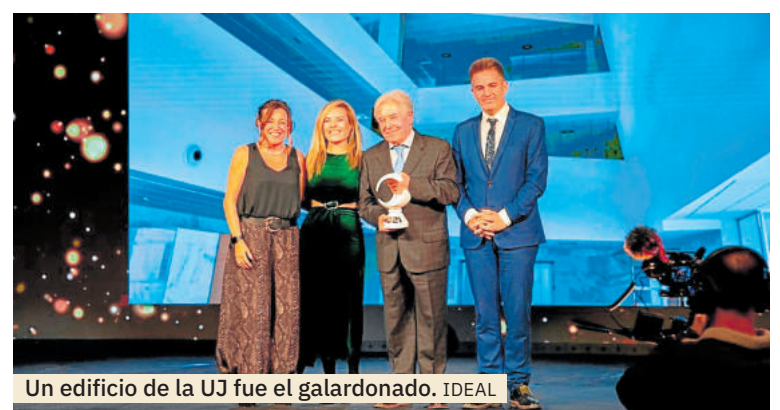
Un edificio de la UJ fue el galardonado. IDEAL