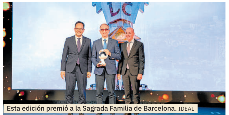
Esta edición premió a la Sagrada Familia de Barcelona. IDEAL