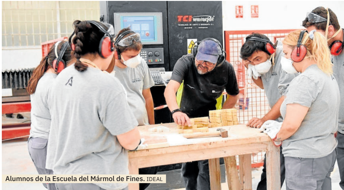
Alumnos de la Escuela del Mármol de Fines. IDEAL

Este centro de Formación Profesional para el Empleo (FPE) adscrito al Servicio Andaluz de Empleo (SAE) está actualmente desarrollando la programación 2025-2026, que aportará a 120 personas tanto desempleadas como trabajadoras ocupadas cualificación y experien-