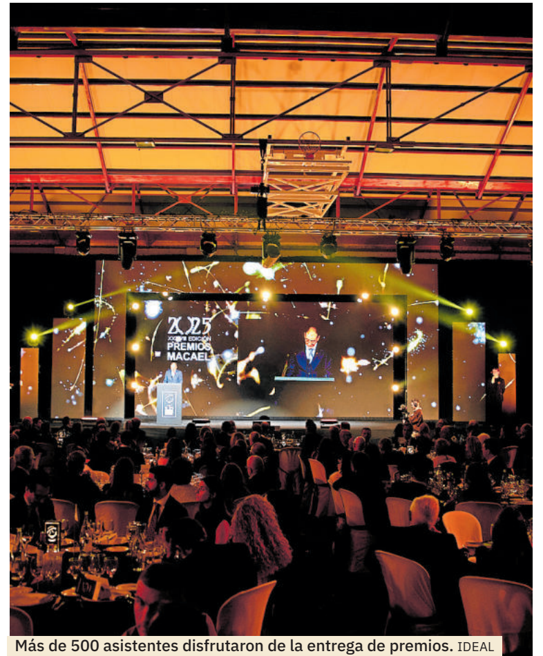
Más de 500 asistentes disfrutaron de la entrega de premios.

Los programas de promoción y las alianzas con centros formativos