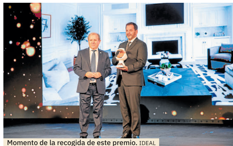
Momento de la recogida de este premio.

piscina y cocina exterior. En el interior destacan pavimentos en piedra natural, chimeneas en mármol Negro Marquina y Blanco Carrara, y una cocina principal en mármol Blanco Carrara. Como elemento singular, resalta una encimera de cuarcita Taj Mahal.