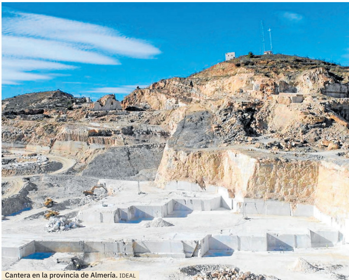
Cantera en la provincia de Almería.

La edición 2025 simbolizó el brillo de lo conseguido, recordando que la Marca Macael sigue siendo historia y futuro.