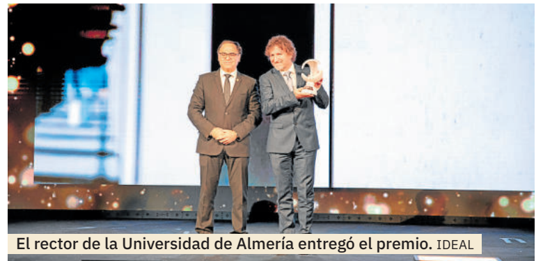
El rector de la Universidad de Almería entregó el premio.