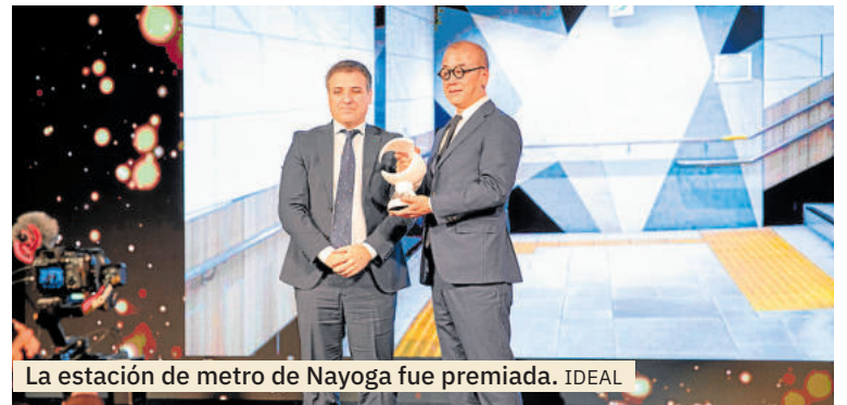
La estación de metro de Nagoya fue premiada. IDEAL

ca pasiva. En la fachada sur, los estanques revestidos en Blanco Macael actúan como superficies reflectantes y elementos de refrigeración natural, mientras que el gran vacío central multiplica la luminosidad interior.