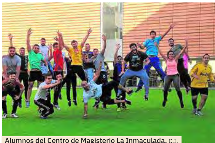
Alumnos del Centro de Magisterio La Inmaculada. C.I.