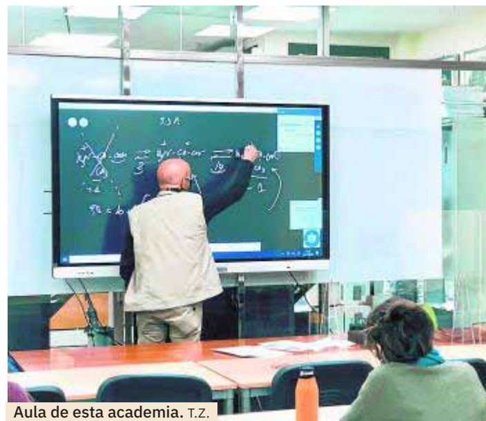
Aula de esta academia.