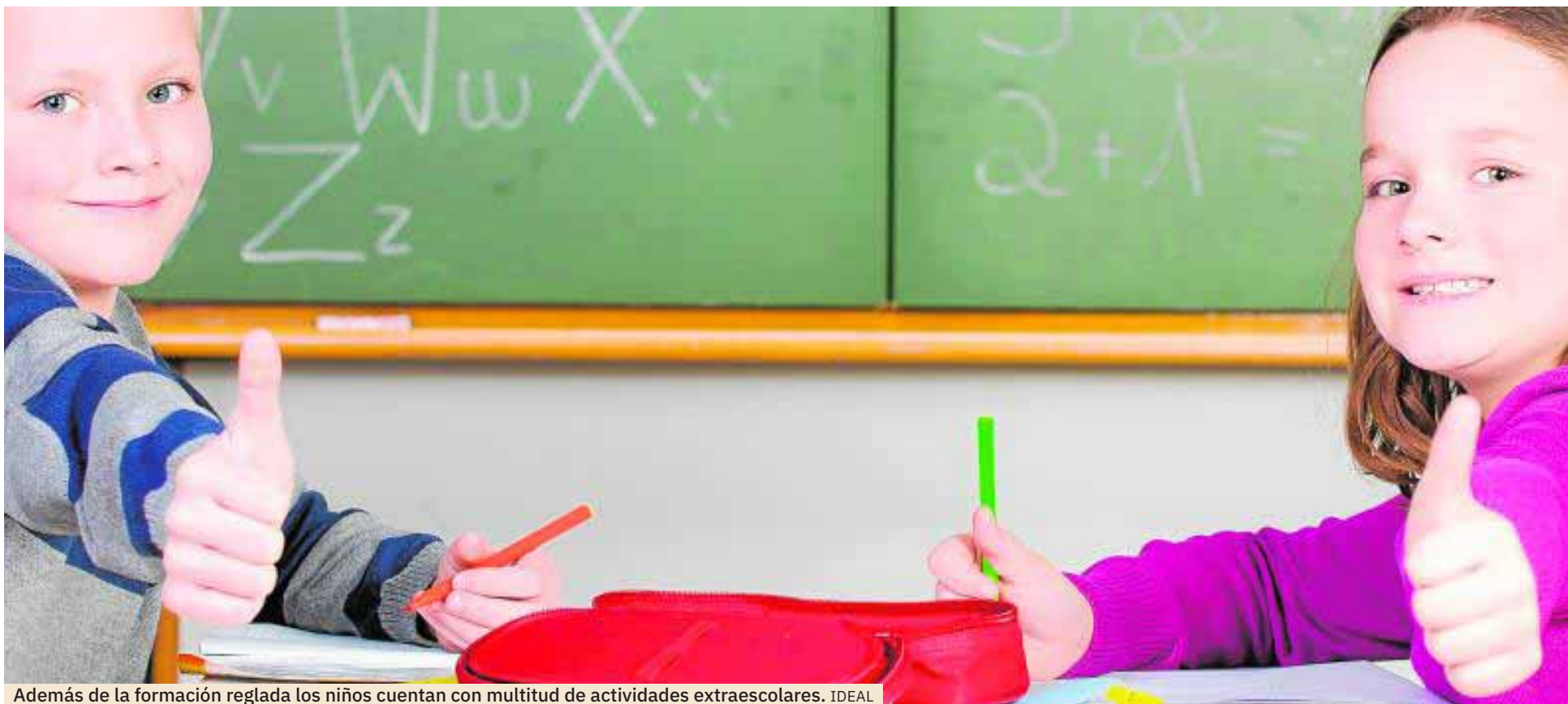
Además de la formación reglada los niños cuentan con multitud de actividades extraescolares. IDEAL

EDUCACIÓN. Los padres se enfrentan al reto de sembrar las semillas para el desarrollo de sus hijos