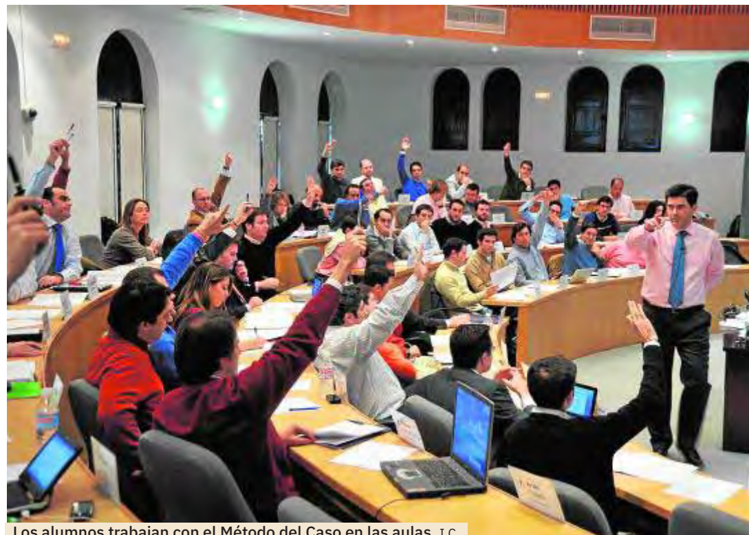
Los alumnos trabajan con el Método del Caso en las aulas. I.C.

—Efectivamente, estamos en momentos de gran incertidumbre para todos. Por eso, para minimizar esa incertidumbre, en San Telmo hablamos y escuchamos a las empresas para que nuestro claustro pueda dar respuesta a esas inquietudes diseñando contenidos completamente adaptados