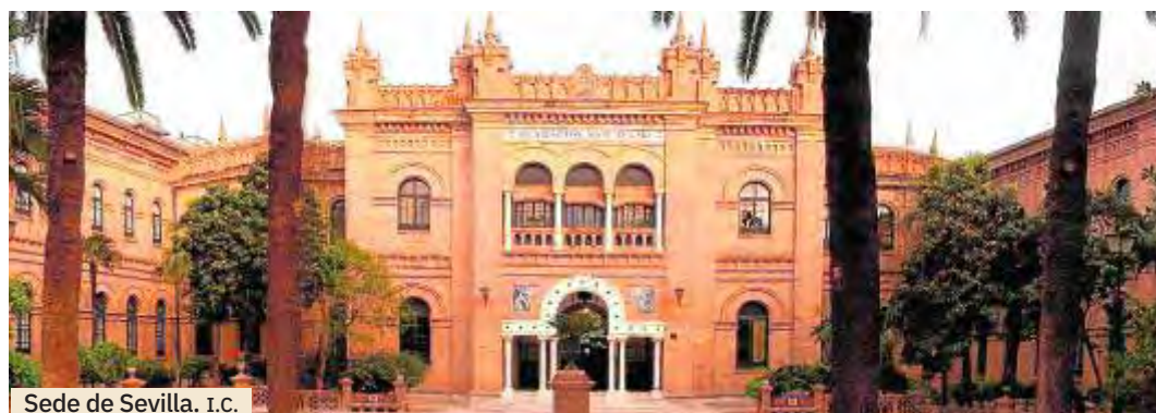
Sede de Sevilla. I.C.