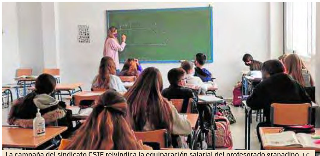
La campaña del sindicato CSIF reivindica la equiparación salarial del profesorado granadino. I.C.

Con esta iniciativa, el sindicato lucha por dignificar al profesorado granadino, con la mejora de sus retribuciones y condiciones laborales entre otros aspectos, ya que, ahora, más que nunca, es el momento de reconocer la labor encomiable de los docentes que no solo han sido un ejemplo de resiliencia durante esta pandemia, sino que también gracias a ellos está siendo posible la reactivación económica, al facilitar también la conciliación laboral de las familias.