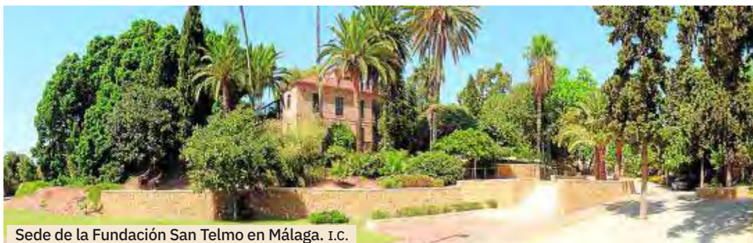
Sede de la Fundación San Telmo en Málaga. I.C.

Para ello, el Programa Lydes cuenta con un estricto proceso de selección. Buscamos universitarios que tengan inquietud por desarrollar una carrera profesional brillante, pero sobre todo, de-