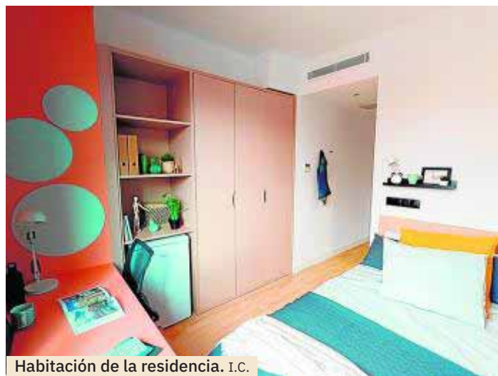
Habitación de la residencia. I.C.

Sus instalaciones incluyen gimnasio, sala de estudio, cocina común equipada, sala con pantalla de proyecciones, sala coworking y terraza. Las habitaciones son individuales, están amuebladas con baño privado, climatización (frío/ calor), y nevera individual y con conexión Wifi de alta velocidad. En su forma de trabajo es básico escuchar a los estudiantes, para ofrecerles modelos de alojamiento y servicios complementarios adecuados a su perfil. El objetivo es ser una parte importante de la vida de los residentes en esa etapa tan crucial de su desarrollo como personas que, en muchos casos, coincide con la primera vez que salen de sus casas. Pero además, ofrecen servicios totalmente ajustados a las necesida-