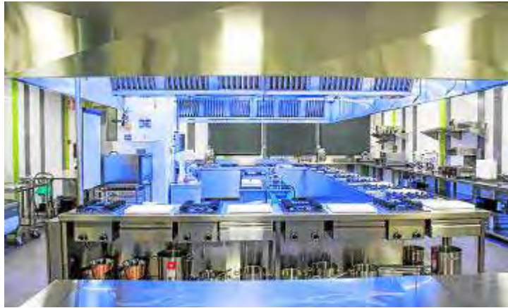
Este centro cuenta con unas modernas instalaciones.

Desde su creación, Grupo Futuro ha experimentado un gran crecimiento y diversificación de sus líneas de negocio. El éxito de este crecimiento se basa en la continua mejora de nuestros procesos, de calidad de la formación que presta, y en la experiencia y entrega de su equi-