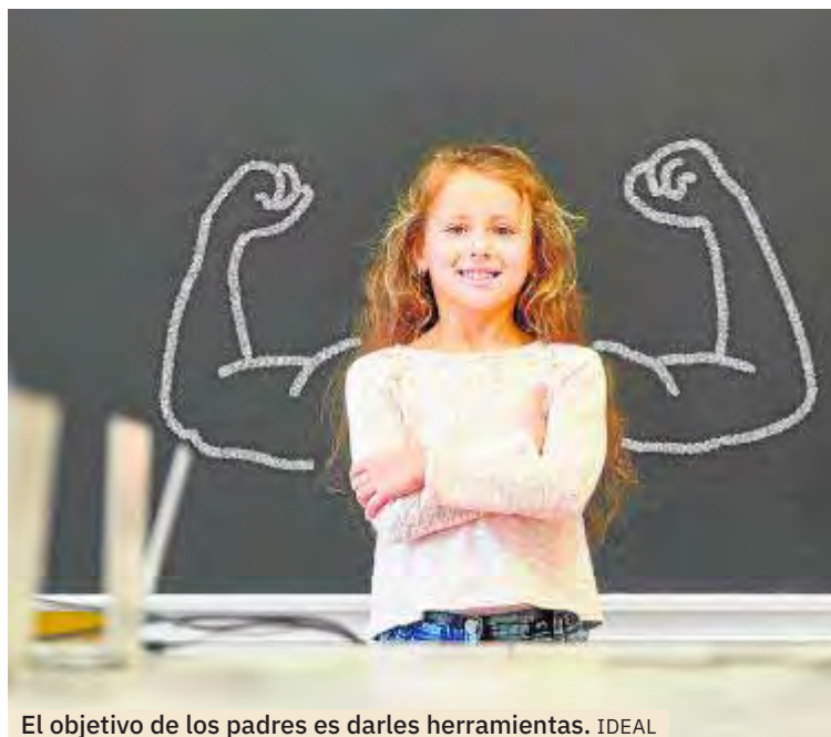
El objetivo de los padres es darles herramientas. IDEAL

Es durante la infancia cuando se asientan las bases para el desarrollo futuro de la persona