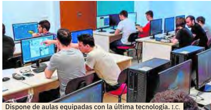
Dispone de aulas equipadas con la última tecnología. I.C.

El Técnico Superior en Desarrollo de Aplicaciones Multiplataforma consiste en una triple titulación