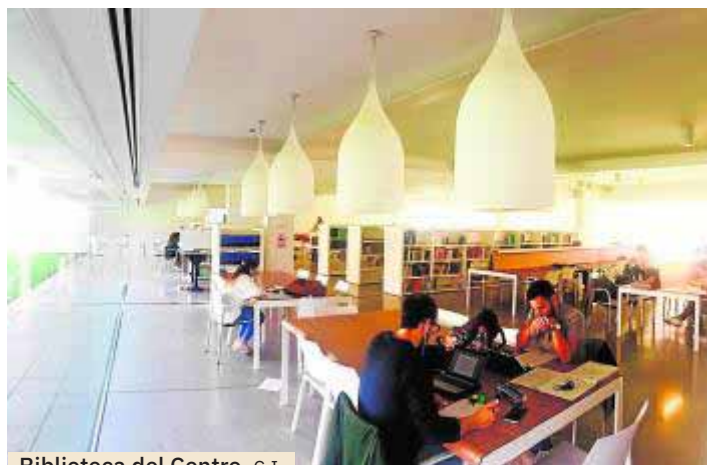
Biblioteca del Centro. C.I.

Con una pedagogía práctica y formación cercana, el centro privado ofrece titulaciones oficiales de la UGR